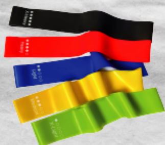
BANDAS ELÁSTICAS DE RESISTENCIA