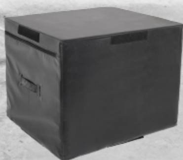
PLYOBOX DE EJERCICIO HIGHSTEP 20 "DE ALTO

Deben ser lo suficientemente firmes para realizar movimientos isométricos pero lo suficientemente suaves para no lastimar tus espinillas si fallas. Las cajas Foam Plyo NO deben usarse en ningún piso liso (madera, concreto liso, baldosas, etc).