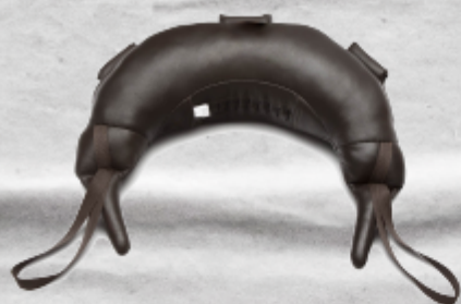
SANDBAG O BULGARIAN BAG DE 30 LBS