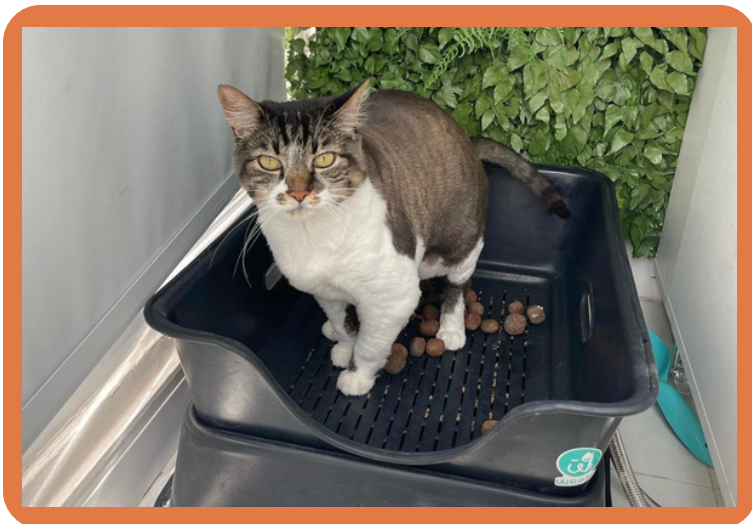
Pisando diretamente na bandeja.

Indicamos o uso de, no máximo, 1/3 de pedrinhas (apenas o suficiente para cobrir o fundo da bandeja). Isso permitirá que as pedrinhas sequem após a limpeza diária ou utilização e não apresentem cheiro.