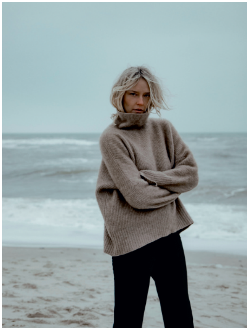
Natur in Balance