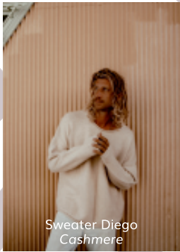
Sweater Diego Cashmere