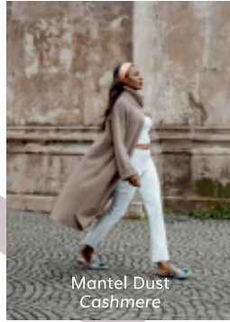
Mantel Dust Cashmere