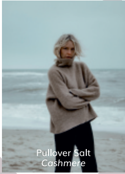
Pullover Salt Cashmere