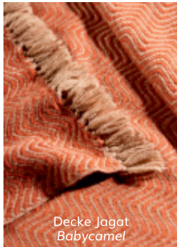
Decke Jagat Babycamel