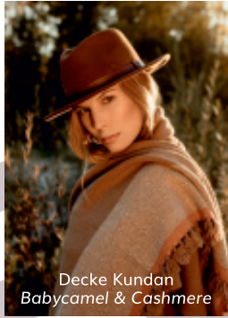
Decke Kundan Babycamel & Cashmere