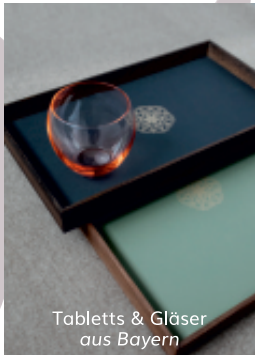
Tablets & Gläser aus Bayern