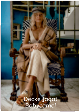
Decke Jagat Babycamel