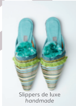
Slippers de luxe handmade