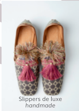
Slippers de luxe handmade