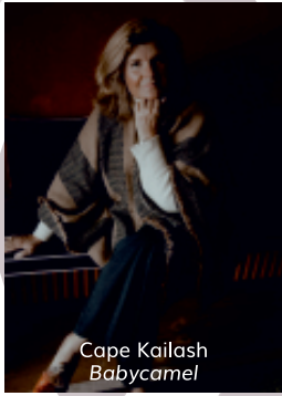
Cape Kailash Babycamel