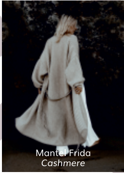
Mantel Frida Cashmere