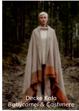
Decke Kala Babycamel & Cashmere