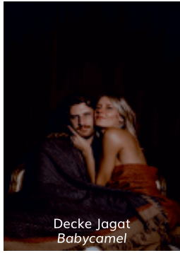
Decke Jagat Babycamel