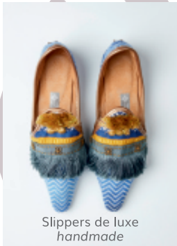
Slippers de luxe handmade