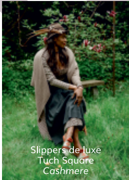
Slippers de luxe Tuch Square Cashmere