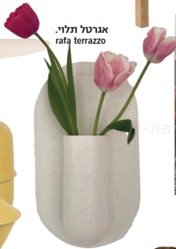
אגרטל תלוי. rafa terrazzo