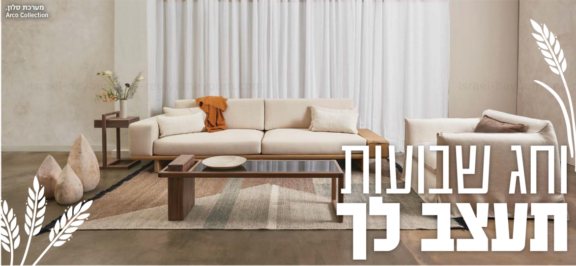
מערכת סלון. Arco Collection