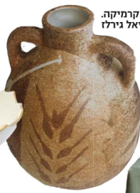
קנקן קרמיקה. מטריאל גירלז