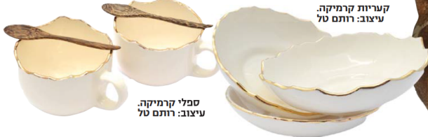
קרמיות קרמיקה. עיצוב: רותם טל