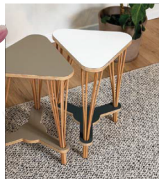
שולחן דיבילים. נדב כספי