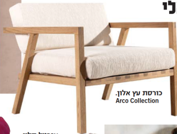
כורסת עץ אלון. Arco Collection