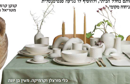
כלי בורצלן וקרמיקה. מעין בן יונה