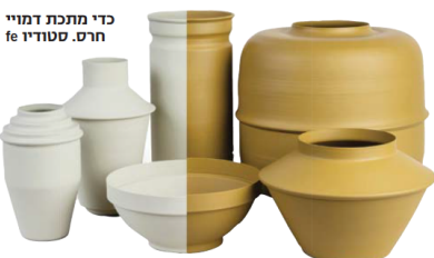
כדי מותכת דמויי חרס. סטודיו fe