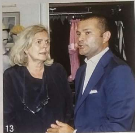
- Moët Hennessy Italia;