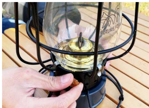
1. つまみを回して灯芯を出します。