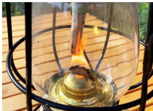
4. チャッカマン等安全に火を付けられる道具を使って 灯芯に火を付けます。