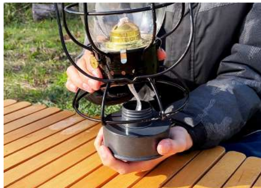
1. オイルランタン底に付いている燃料タンクを回して取り外します。