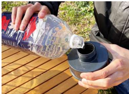
2. ランタン用パラフィンオイルを燃料タンクに入れます。 この際入れすぎるとこぼれる危険性があるので 容器の7割くらいを目安に入れてください。