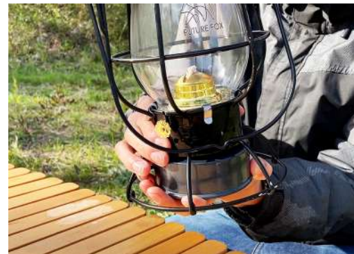
3. 燃料タンクをランタンにはめて外れない様 しっかりと閉めて下さい。