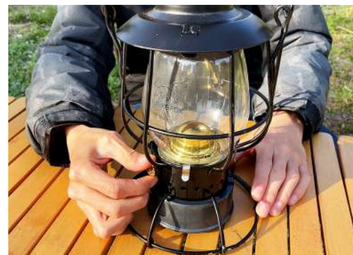
6. 消火の際はつまみで火が見えなくなるまで芯を 下げます。この時芯が燃料タンクに落ちるまで 下げない様注意して下さい。