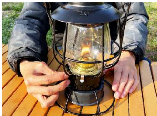
5. 点火後はつまみで火力を調節してください。 灯芯は1～2ミリ程度出すことをおすすめします。 芯を出しすぎるとススが出てしまうので注意して下さい。