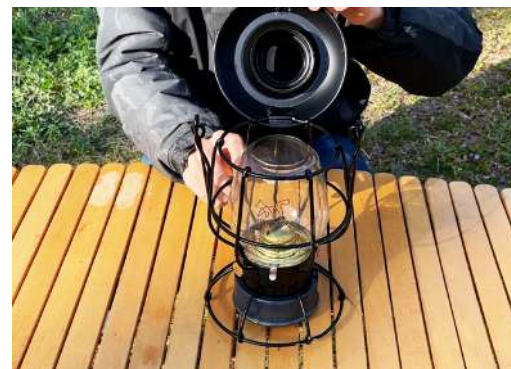
3. 上蓋を外すと上図ようになります。