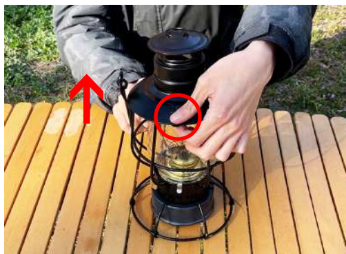
2. 図の赤丸部分のロックを掴んで上蓋を外します。