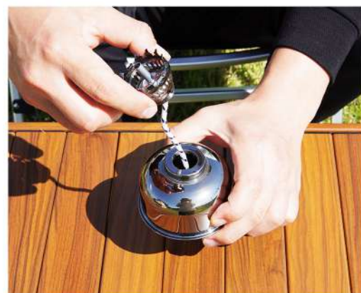
6. 灯芯調節部品をオイルタンクに戻します。