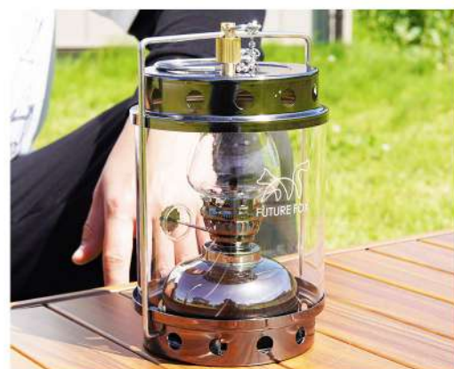
9. 不備がないか確認して完成です。