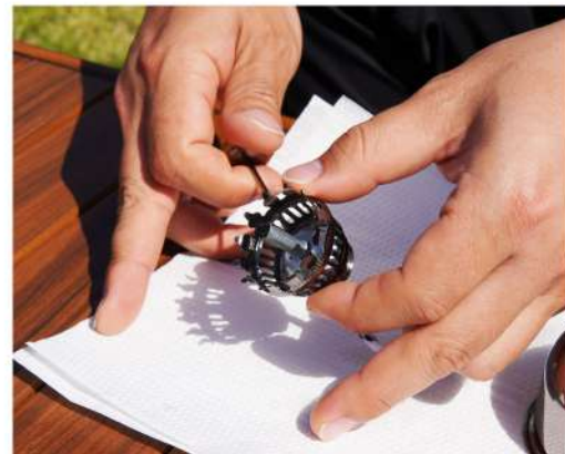
3. つまみを回して古い灯芯を外します。