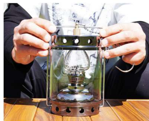
7. 各パーツを順番通りに戻します。外ガラスホヤ取り付けの際はガラスがしっかりハマっているか固定フレームがしっかりとハマっているか確認を行ってください。