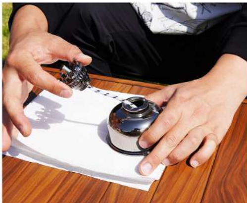
2. 灯芯調節部品を取り出します。この際灯芯がオイルに浸っている場合オイルが垂れない様注意して下さい。