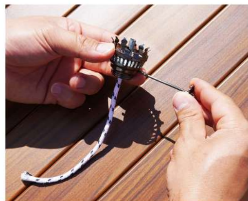
4. 下から新しい灯芯を差し込みます。