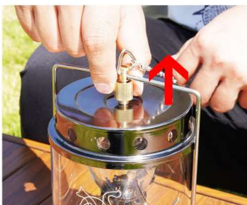
8. 上蓋についている固定部品を回して全体を固定します。