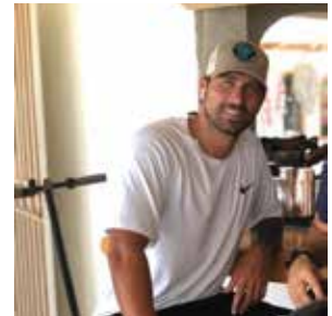
@marcoboriello 1 MLN