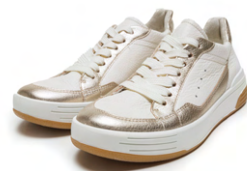
MASTER - [12-25700] color PLATIN, CREAM 31,900円(税込)