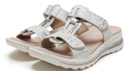
TAMPA - [12-47206] color NEBBIA 23,100円(税込)