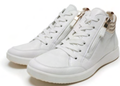
ROMA - [12-23907] color WEISS, PLATIN 31,900円(税込)