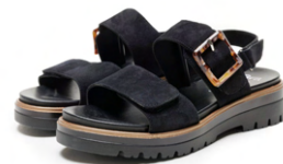
MALAGA - [12-21003] color SCHWARZ 27,500円(税込)