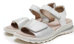
TAMPA - [12-47207] color WEISS,NEBBIA 24,200円(税込)