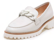
KENT 2.0 【NEW】 - [12-31209] color CREAM 29,700円(税込)