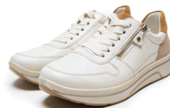
SAPORO - [12-27540] color CREAM,CAMEL,SAND 31,900円(税込)