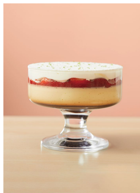
「プリン・ア・ラ・モード シーズナル (いちご)」