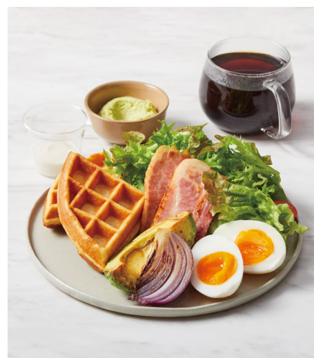
「ランチプレート コンプレ ミート」

古代小麦と米粉をベースにした、ふんわりとした甘みと香ばしさを感ずるお食事にぴったりのワッフルと一緒に、たっぷりの季節のお野菜が楽しめる、ブルーボトルコーヒーで好評いただいているメニューです。シンプルに塩とオリーブオイルで味付けされた季節のグリル野菜に、平飼卵のゆで卵、季節のフムス、そしてはちみつを塗って香ばしく焼き上げたベーコンが乗った「コンプレ ミート」や、お野菜、平飼卵のゆで卵、フムスを添えた「ベジタブル」、野菜をたっぷり乗せた「サラダ」の3種類をご用意しております。ローカリティも感じていただきたいという想いから、名古屋栄カフェでは店内のボトルロゴと照明も製作いただいた、岐阜の器とタイルのメーカー「寿山」にオリジナルで製作いただいたプレートでご提供いたします。モーニングやランチなど、さまざまなシーンでその日のご気分に合わせてお楽しみいただけると嬉しいです。