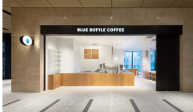
京都木屋町カフェ [2020/7/23] 京都府京都市中京区蛸薬師河原町 東入備前島町 310-2