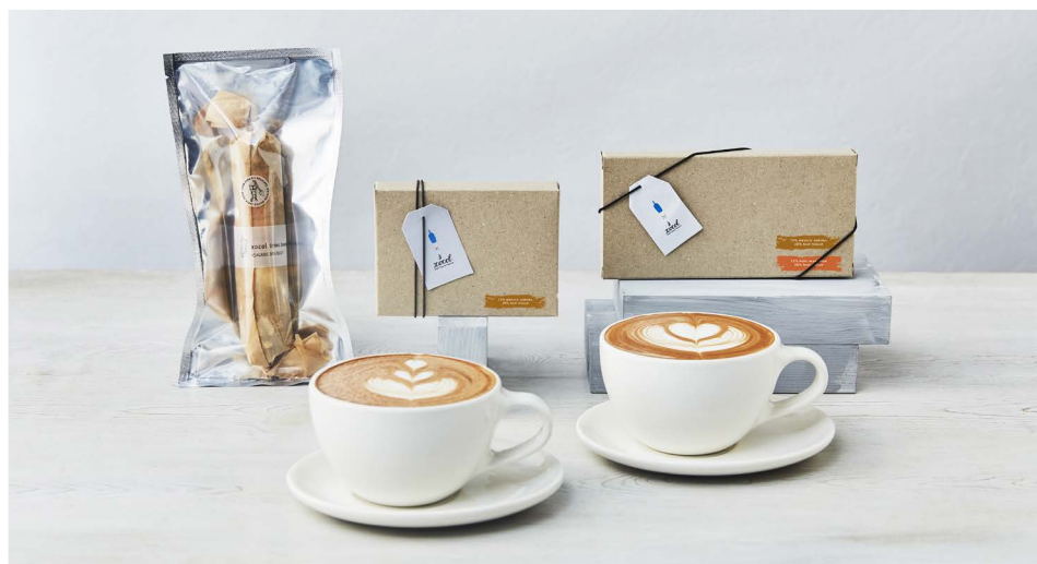
後方左：チョコレート バトン、後方中央：ブルーボトルコーヒー チョコレート コイン（10枚入り）、後方右：ブルーボトルコーヒー チョコレート コイン（20枚入り）、 前方左：シングルオリジンカカオ ホットチョコレート、前方右：シングルオリジンカカオ モカ

ブルーボトルコーヒージャパン合同会社（本社：東京都江東区）は、 2021年1月25日（月）よりブルーボトルコーヒー カフェ全店にてバレンタイン商品の販売を順次スタートいたします。 今年では世田谷・深沢のBean to Barのチョコレートブランド“xocol（ショコル）”とコラボレートし、 産地による味の違いを楽しめるシングルオリジンカカオを使用した、 “自分の好きと出会い、人生をより豊かにするバレンタイン”をご提案します。