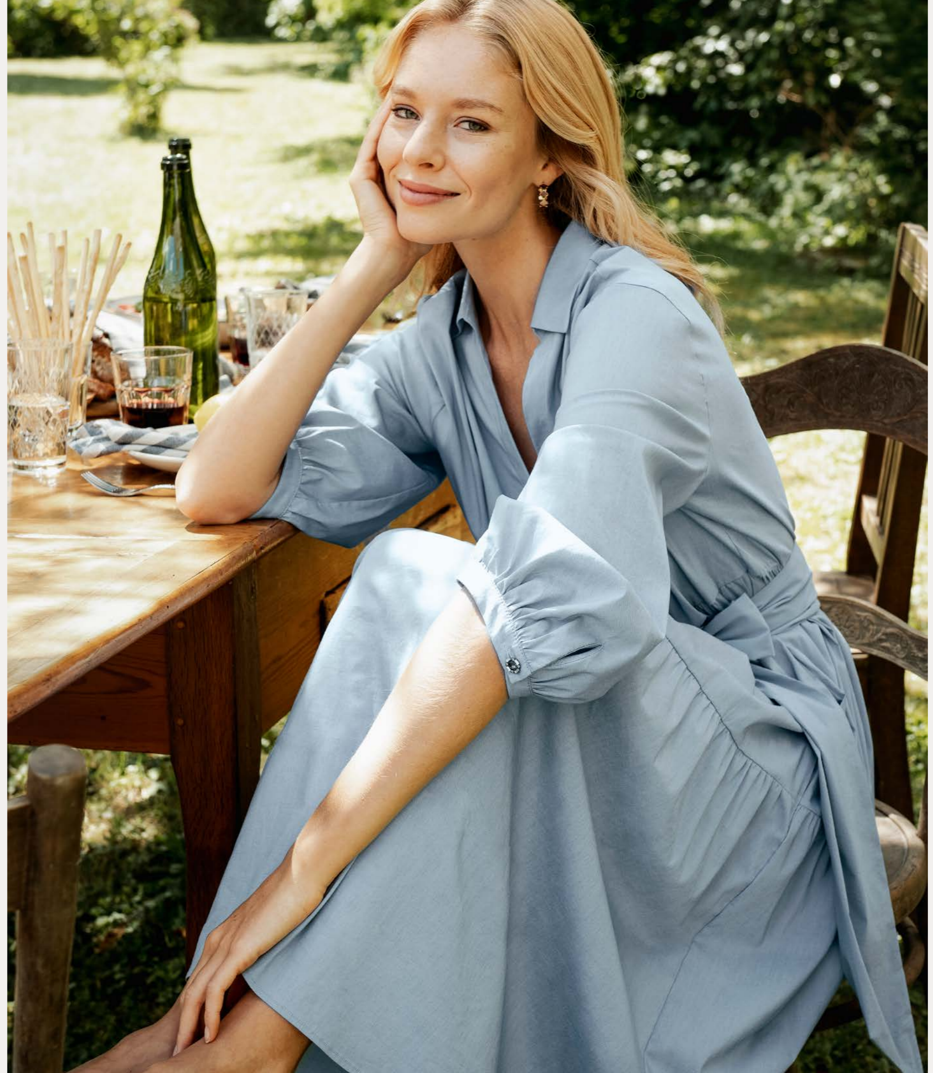
Kleid 9615-45 Fb. 51