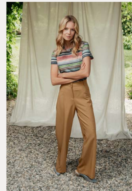
Shirt 9803-74 Fb. 89 Hose 9261-29 Fb. 43