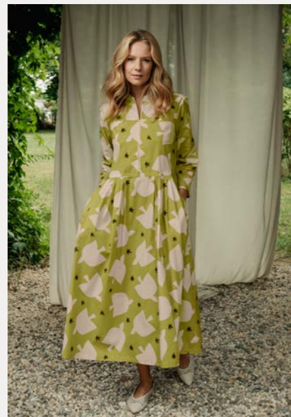
Kleid 9609-30 Fb. 31