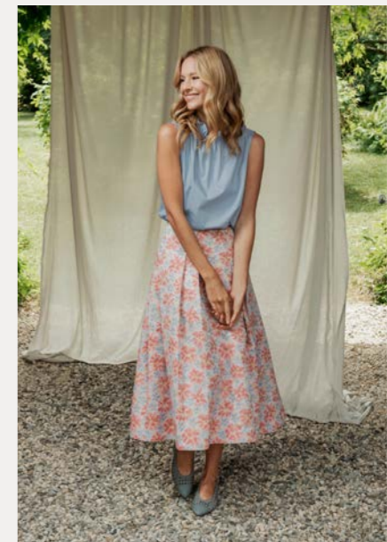
Top 9426-45 Fb. 51 Rock 9080-32 Fb. 60