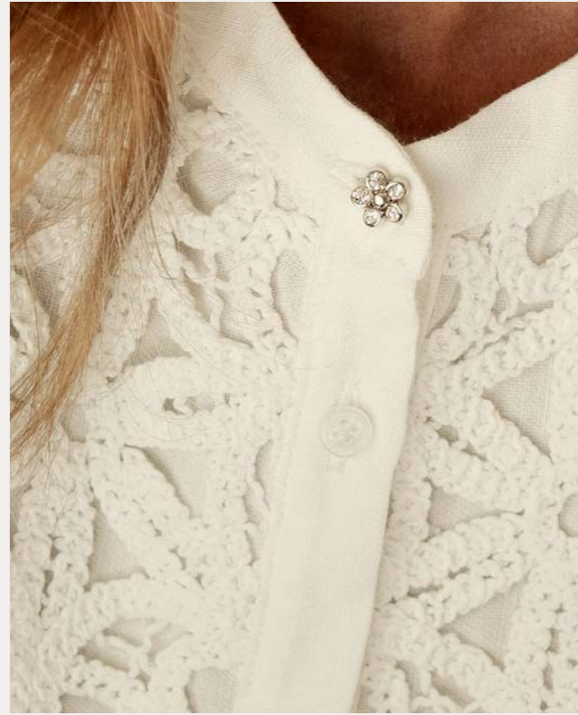
Bluse 9453-17 Fb. 11