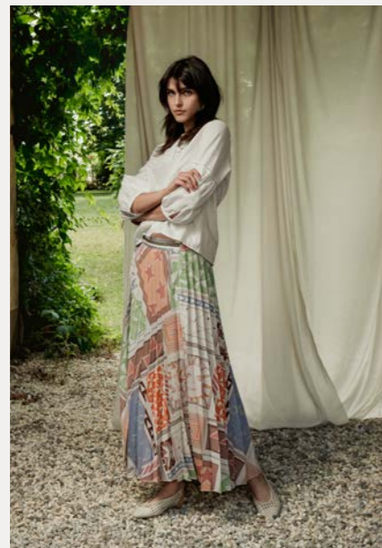
Bluse 9488-17 Fb. 11 Rock 9013-15 Fb. 14