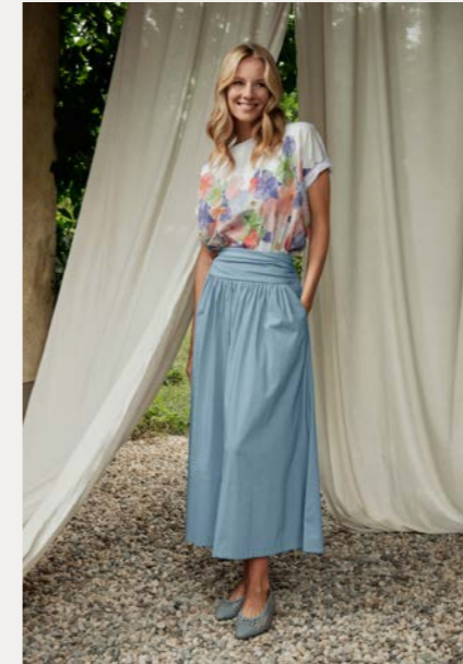
Shirt 9800-76 Fb. 11 Rock 9079-45 Fb. 51