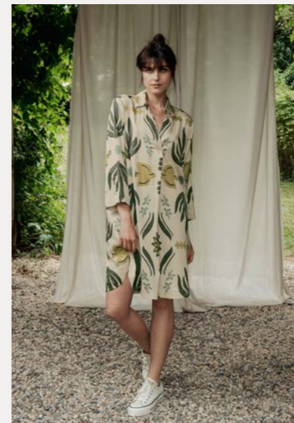
Kleid 9664-37 Fb. 11