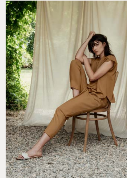
Bluse 9451-29 Fb. 43 Hose 9253-29 Fb. 43