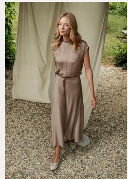
Blusenshirt 9867-81 Fb. 14 Rock 9067-34 Fb. 48