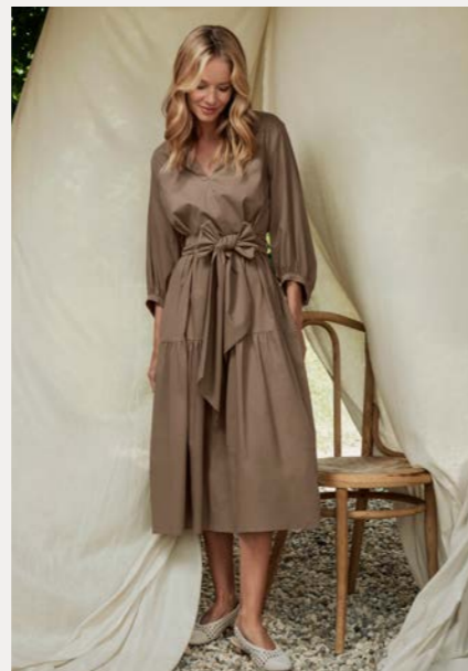
Kleid 9615-45 Fb. 14