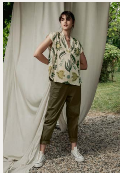
Bluse 9451-37 Fb. 11