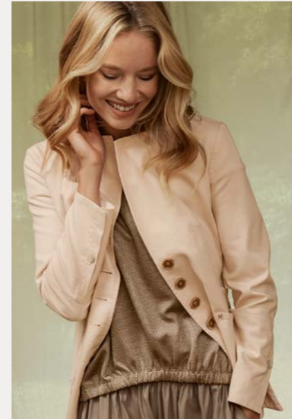
Blazer 9530-11 Fb. 66 Shirt 9877-34 Fb. 48