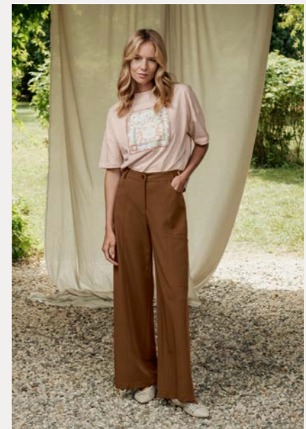
Shirt 9800-76 Fb. 68 Hose 9261-29 Fb. 48