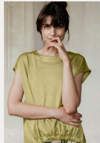
Shirt 9877-34 Fb. 31