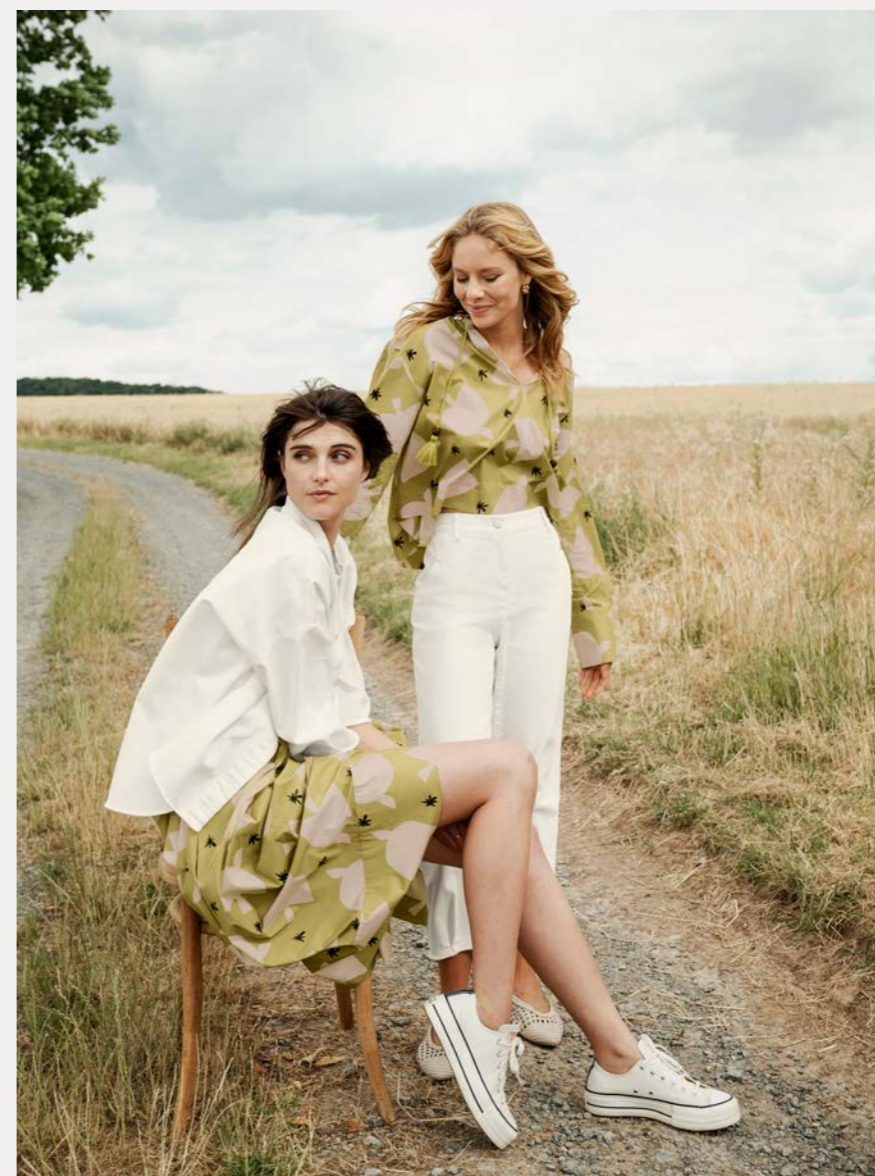
Denimhemd 9464-11 Fb. 11 Rock 9040-30 Fb. 31