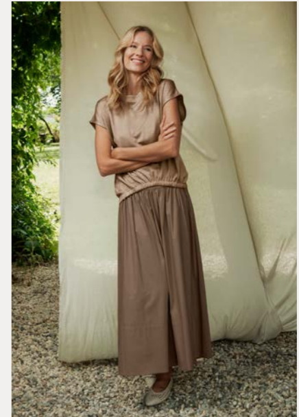
Shirt 9877-34 Fb. 48 Rock 9079-45 Fb. 14