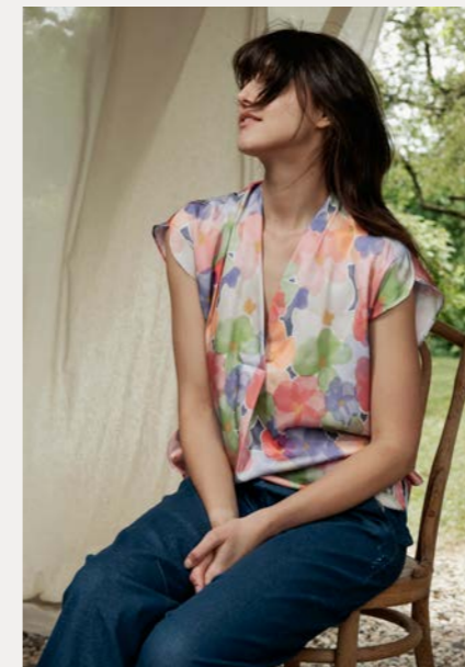
Bluse 9451-37 Fb. 52 Jeans 9257-11 Fb. 55