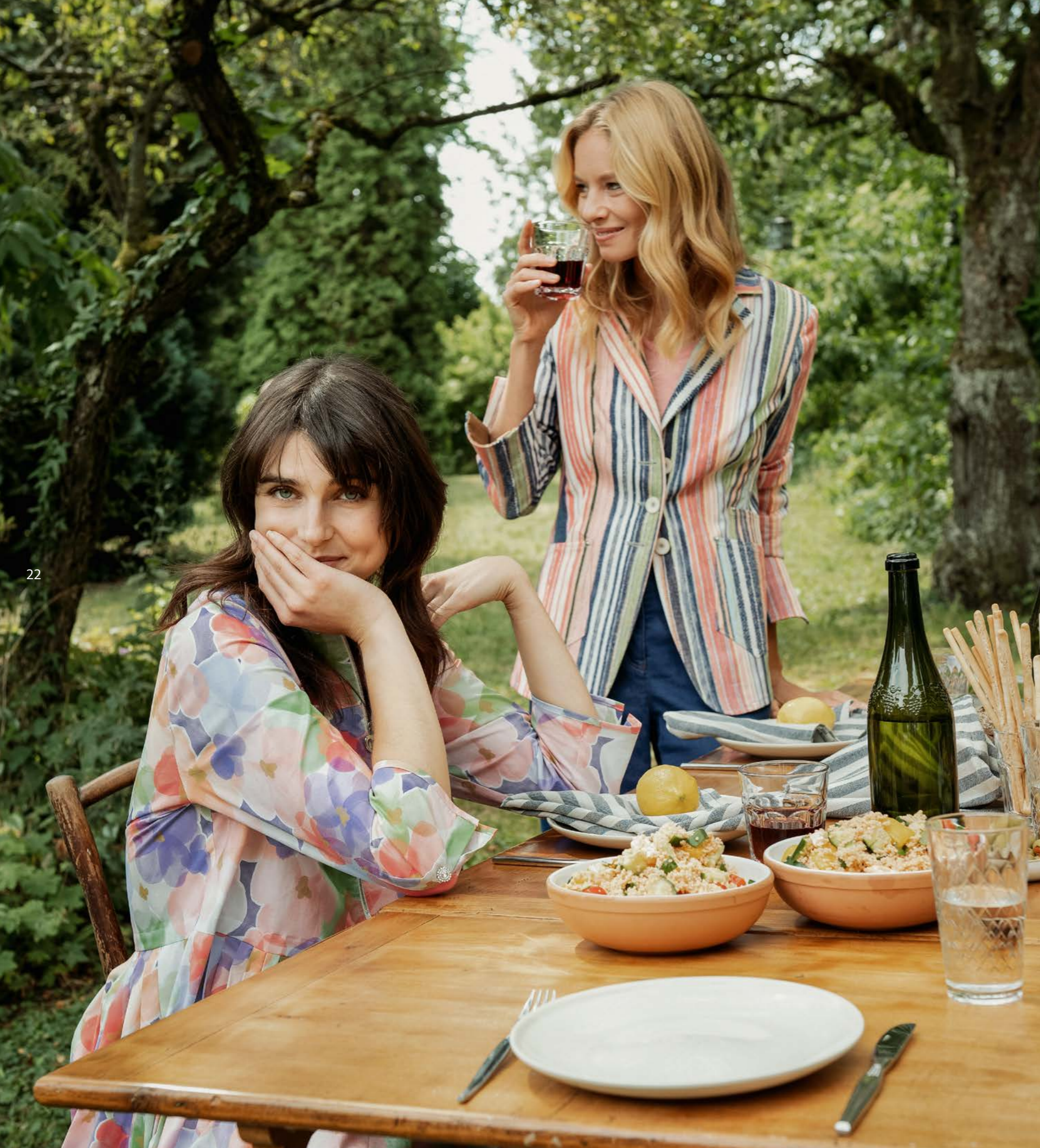
Blazer 9530-33 Fb. 89 Shirt 9807-79 Fb. 68 Denim 9257-11 Fb. 55