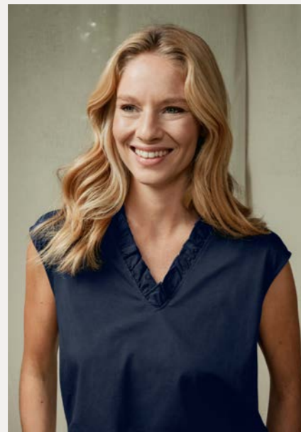
Shirt 9815-71 Fb. 50