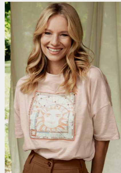
Shirt 9800-76 Fb. 68