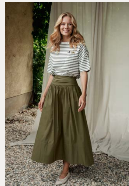
Shirt 9800-73 Fb. 49