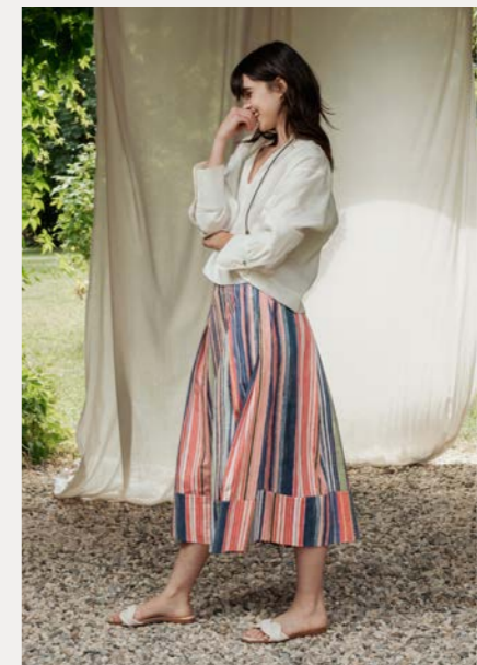
Bluse 9456-17 Fb. 11 Rock 9040-30 Fb. 89