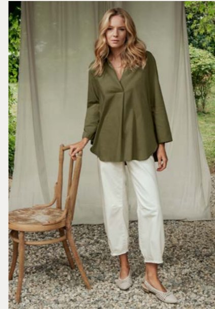
Bluse 9471-45 Fb. 49