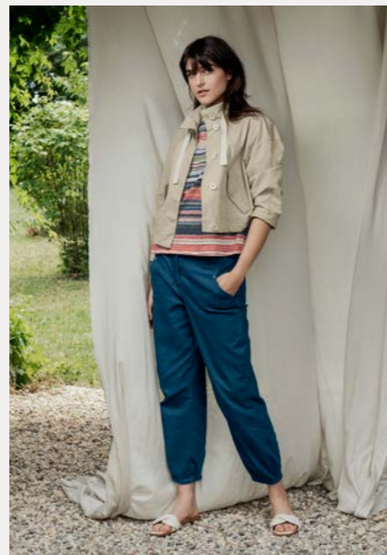
Jacke 9511-27 Fb. 13 Shirt 9800-75 Fb. 89 Jeans 9257-11 Fb. 55