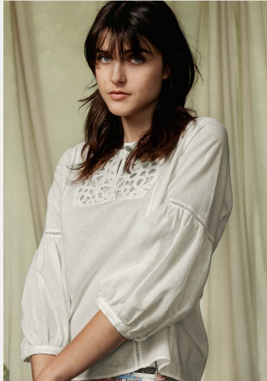
Bluse 9488-17 Fb. 11