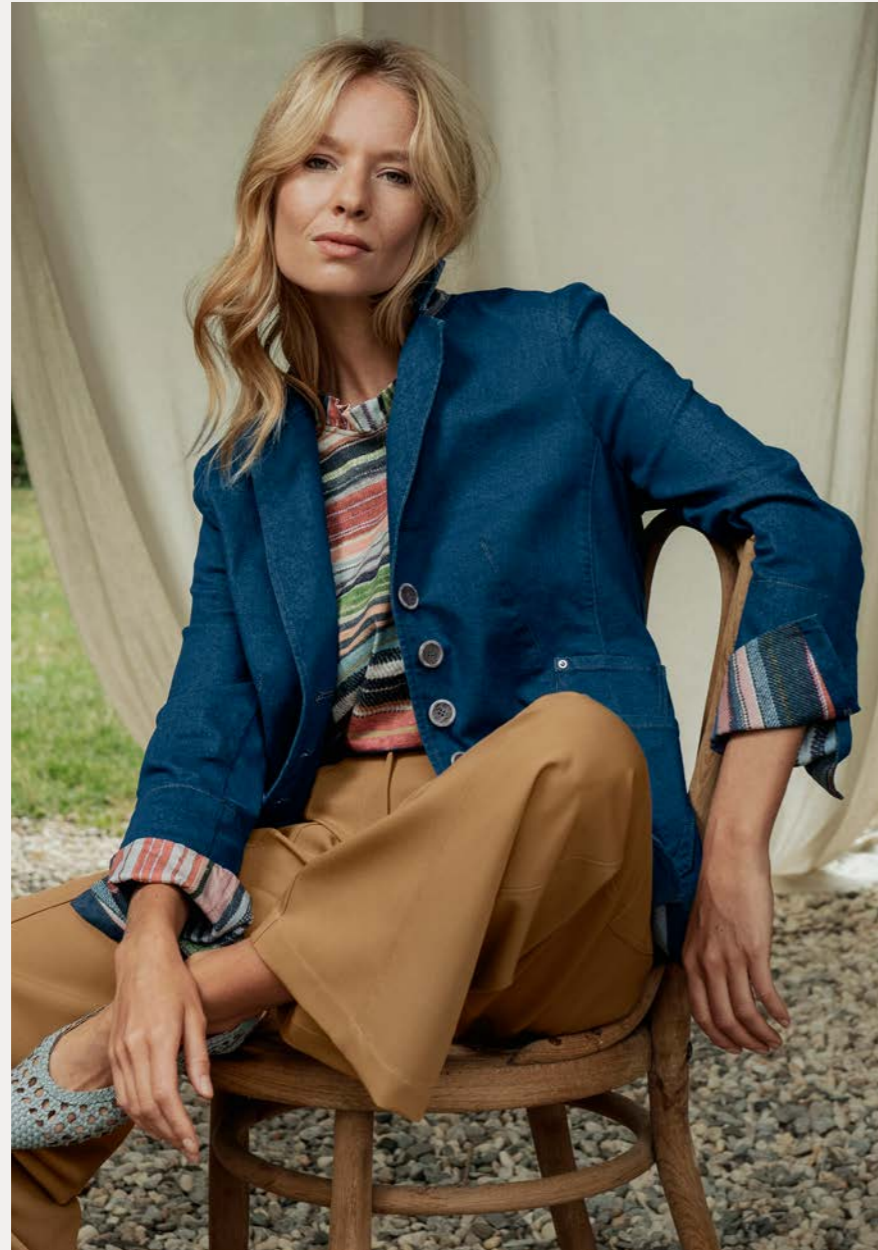
Blazer 9530-11 Fb. 55 Shirt 9803-74 Fb. 89 Hose 9261-29 Fb. 43