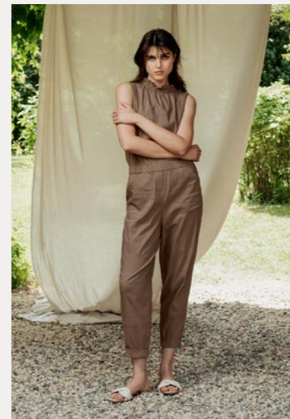
Top 9426-45 Fb. 14 Hose 9248-45 Fb. 14