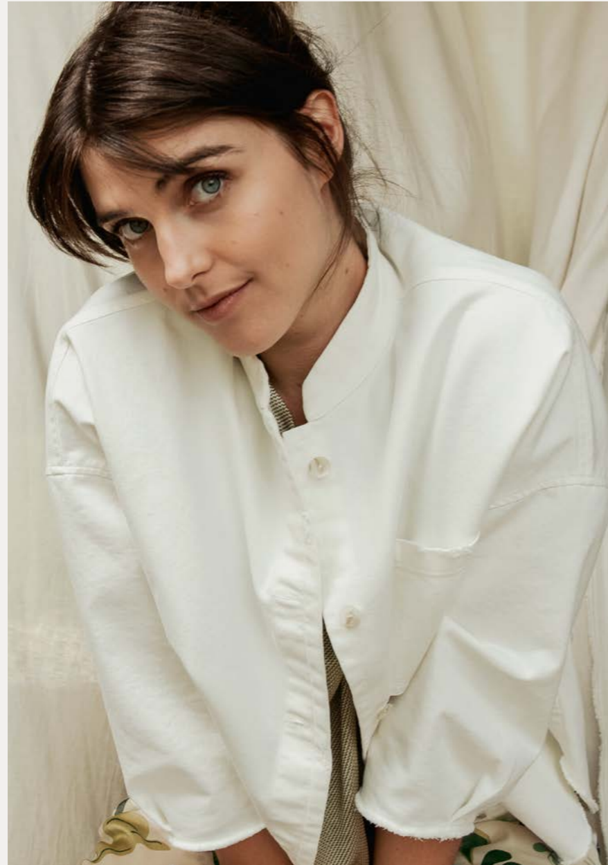
Hemd 9464-11 Fb. 11