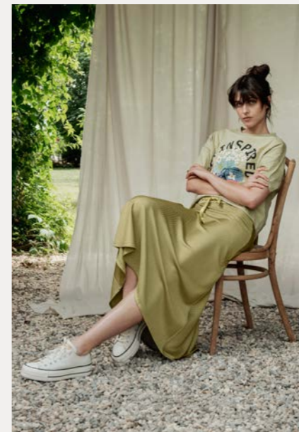
Shirt 9800-76 Fb. 83