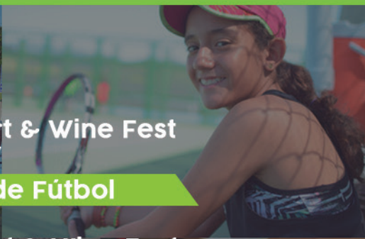
Torneo de Tenis