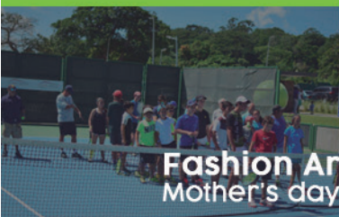
Fashion Art & Wine Fest Mother's day