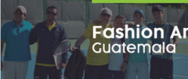
Fashion Art & Wine Fest Guatemala