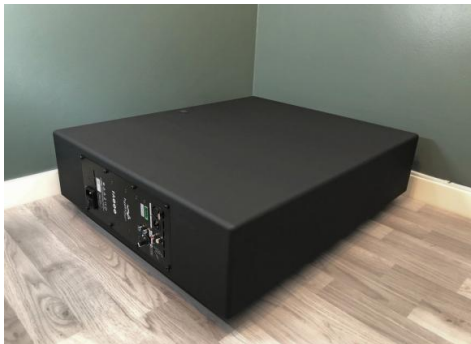
Arbeid hos Hundsbedt Trebygg stod for produksjonen av pre-produksjonsmodellene

Jeg opplever Inkognito 10 som en meget kapabel subwoofer, og den spiller knallfint sammen med KEF LS50meta, og den skaper et høyttalersystem som det er veldig, veldig vanskelig å matche til kr. 40.000.-. En ting er at de små høyttalerne spiller knallfint på egen hånd, men lydbildet blir både større, tyngre og oppfattes bedre balansert, selv om subwooferen knapt står på.