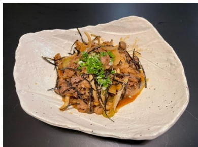
$16.80 Truffle Oil Yaki Niku (beef) トリュフルオイル牛肉炒め