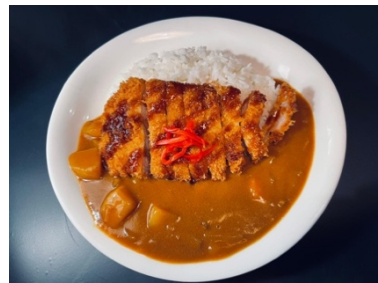
$17.80 Buta Katsu Curry Don カツカレー