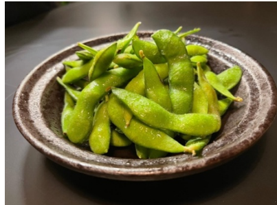
$6.80 Edamame えだまめ