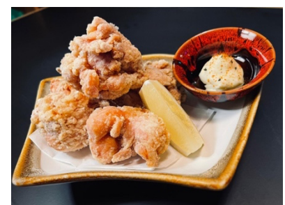
$8.80 Tori Karaage (Chicken) 鳥唐揚げ