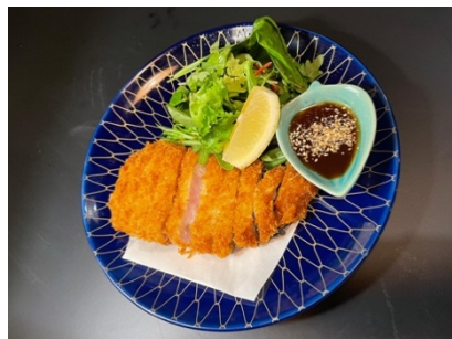
$11.80 Buta Katsu (Pork) 豚カツ