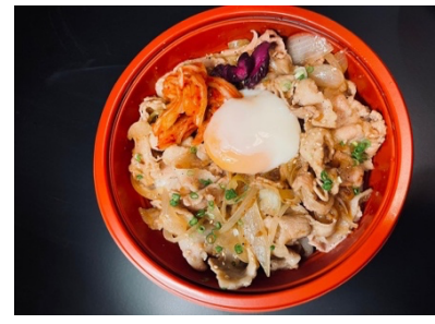
$17.80 Truffle Oil Pork Don トリュフルオイル豚肉丼