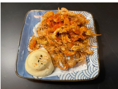
$9.80 Age Kawa Ebi 揚げ川エビ