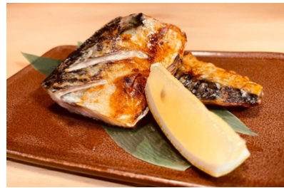
$10.80 Saba Shio Yaki 鯖の塩焼き