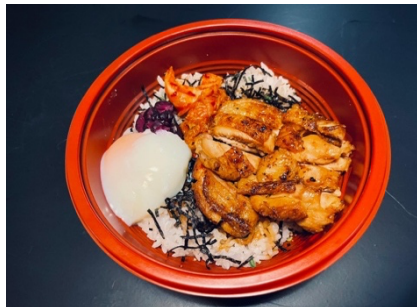
$11.80 Chicken Teriyaki Don チキン照り焼き丼