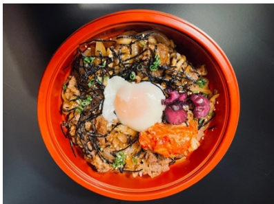
$19.90 Truffle Oil Yaki Niku Don (beef) トリュフルオイル牛肉丼

Yorimichi Call : 97240270 Address : 6001 Beach Road #01-02 Golden Mile Tower Singapore 199589