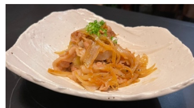
$14.80 Truffle Oil Pork トリュフオイル豚肉炒め