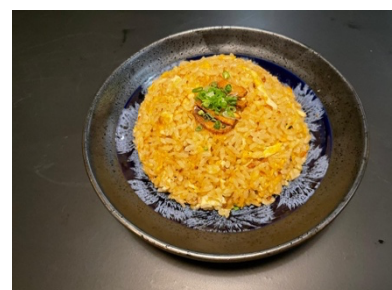
$8.80 Niniku Chahan にんにくチャーハン