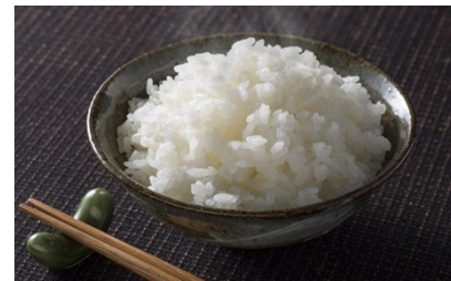
$2.50 Rice ご飯