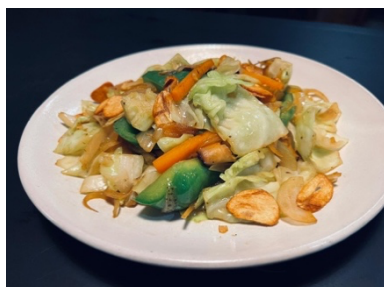
$9.80 Yasai Itame 野菜炒め