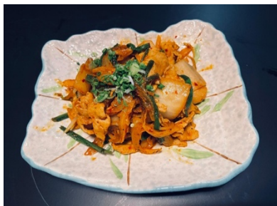
$11.80 Kimuchi Pork 豚キムチ