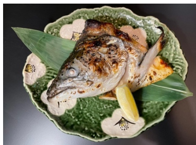
$10.00 Salmon Head Grilled 鮭の兜焼き