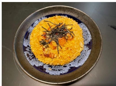
$15.80 Unagi Chahan うなぎチャーハン