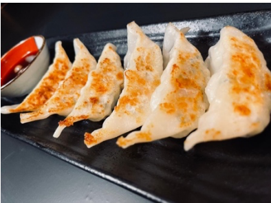
$9.80 Yaki Gyoza (6pcs) 焼き餃子