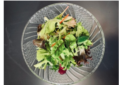
$7.80 Vegetable Salad 野菜サラダ