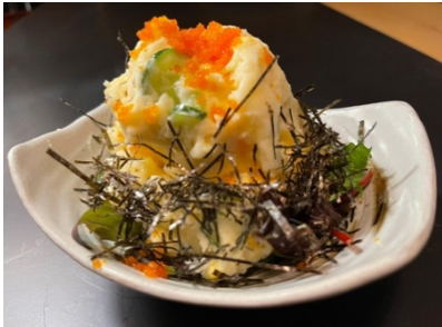
$7.80 Potato Salad ポテトサラダ