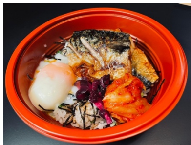
$13.80 Saba Shio Yaki Don 鯖の塩焼き丼