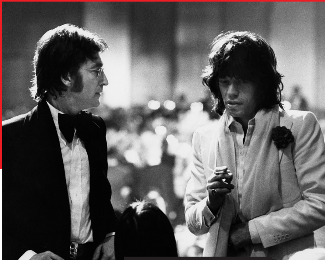
JOHN LENNON E MICK JAGGER

Foto di DAVID BOWIE - MADONNA - MICHAEL JACKSON - CHER - ALICE COOPER - FRANK ZAPPA - BARBRA STREISAND - LIZA MINNELLI - BRUCE SPRINGSTEEN - DIANA ROSS - BOB DYLAN - ELVIS PRESLEY - FRANK SINATRA - RINGO STARR - ELTON JOHN - PAUL MCCARTNEY - SIMON AND GARFUNKEL