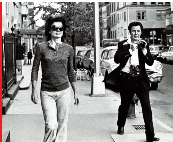
JACKIE KENNEDY ONASSIS E RON GALELLA

Ron Galella, Paparazzo Superstar non è solo una mostra fotografica; è soprattutto un viaggio nella memoria di un'epoca, un'opportunità per scoprire punti di vista originali su quei personaggi iconici che compongono la mitologia pop condivisa da intere generazioni.