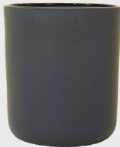
Aura - fumée