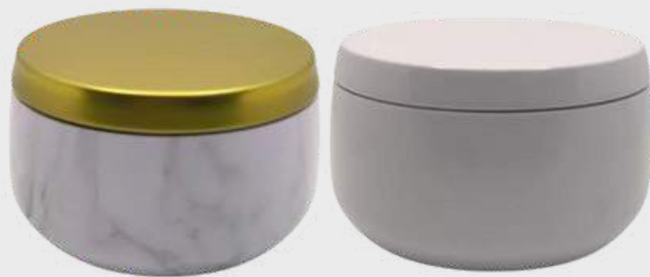
Boîtes marbre et blanc