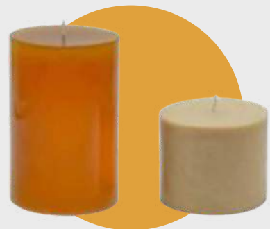
Teinture caramel au beurre