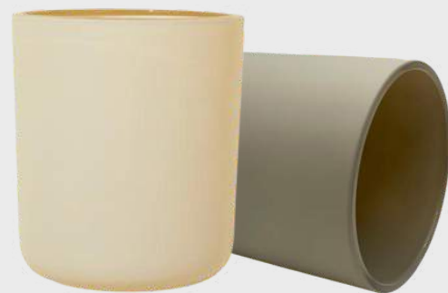
Pots Aura de couleur crème et blanchis à la pierre