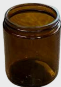
Côté droit en ambre