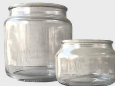
Pots traditionnels avec couvercle en verre