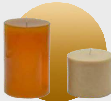
Teinture au miel doré