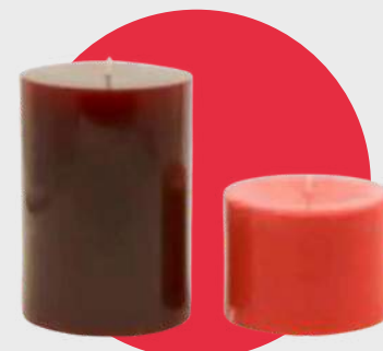
Teinture à la cannelle