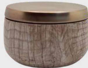
Boîte - Grain de bois