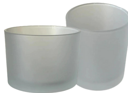
Pots Lux givrés