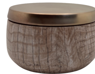
Pots en étain grain de bois