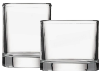
Pots Lux transparents