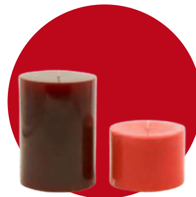
Teinture à la cannelle