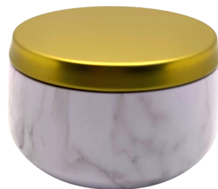
Pots en étain en marbre de Carrera