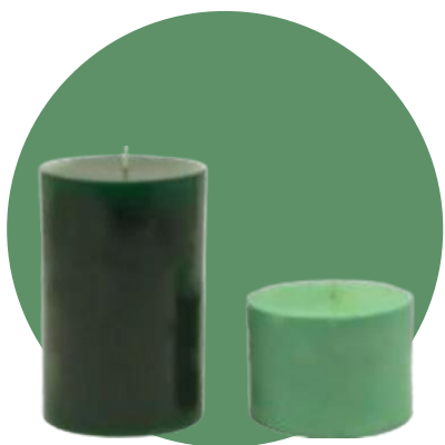
Teinture vert chasseur

Ajoutez une touche de personnalité à votre ligne de bougies avec ces tendances de couleurs d'été 2022. Vous les verrez mis en valeur dans les industries de la mode et de la décoration intérieure tout au long de la saison.