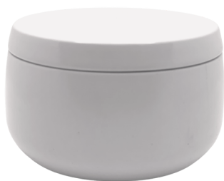
Pots en étain blanc

Des couleurs neutres douces combinées à des textures simples et lisses dominent les tendances des contenants à bougies cette saison. Ces beaux pots classiques seront la base parfaite pour votre collection d'été. Ils peuvent être associés à une variété de couleurs de cire et de motifs d'étiquettes pour leur donner un look unique et chic.