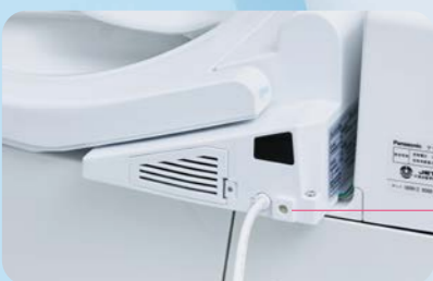
盗難防止対策の いたづら防止 カバー

リモコンは固定可能な仕様で、管理者以外は取り外しが不可。便座についても、取り外しボタンに、いたづら防止カバー付き