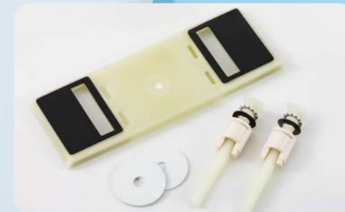
標準ベースプレートセット