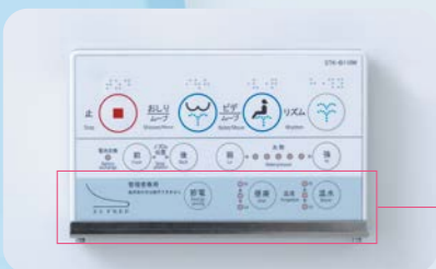
リモコンの 管理者専用ボタン