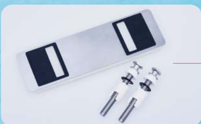
金属ベース プレートセット (別売)

金属板と金属ボルトで補強することで、車いすから便座に移乗する際など、強い力が加わっても便座が横ずれしにくい