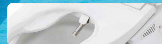
操作部 袖タイプ 衛生的なステンレスノズル