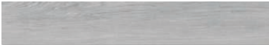
Kokkola-R Gris G.172