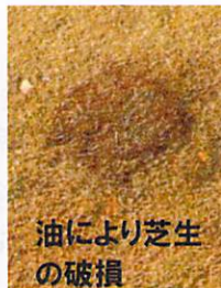
油により芝生の破損