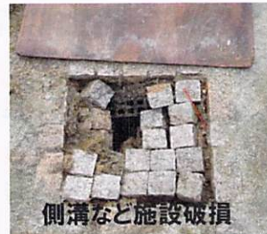
側溝など施設破損