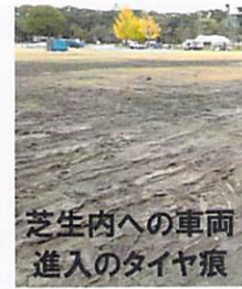
芝生内への車両進入のタイヤ痕