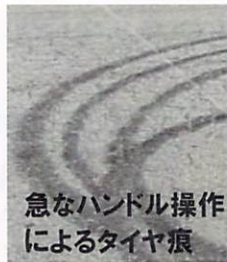
急なハンドル操作によるタイヤ痕