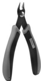
Art. Nr. 170688 SPEZIAL-SEITENSCHNEIDER

Vloeibare lijm in plastic-flescon met doseerbuisje om nauwkeurig te lijmen.