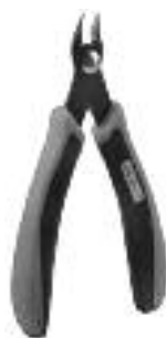
Art. Nr. 170688 SPEZIAL-SEITENSCHNEIDER

Vloeibare lijm in plastic-flescon met doseerbuisje om nauwkeurig te lijmen.