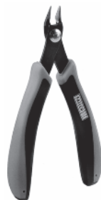
Art. Nr. 170688 SPEZIAL-SEITENSCHNEIDER

Vloeibare lijm in plastic flescon met doseerbuisje om nauwkeurig te lijmen.