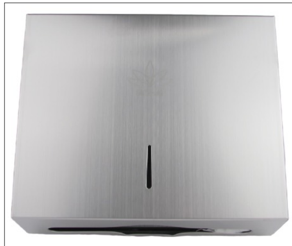
LLAVE DE SEGURIDAD