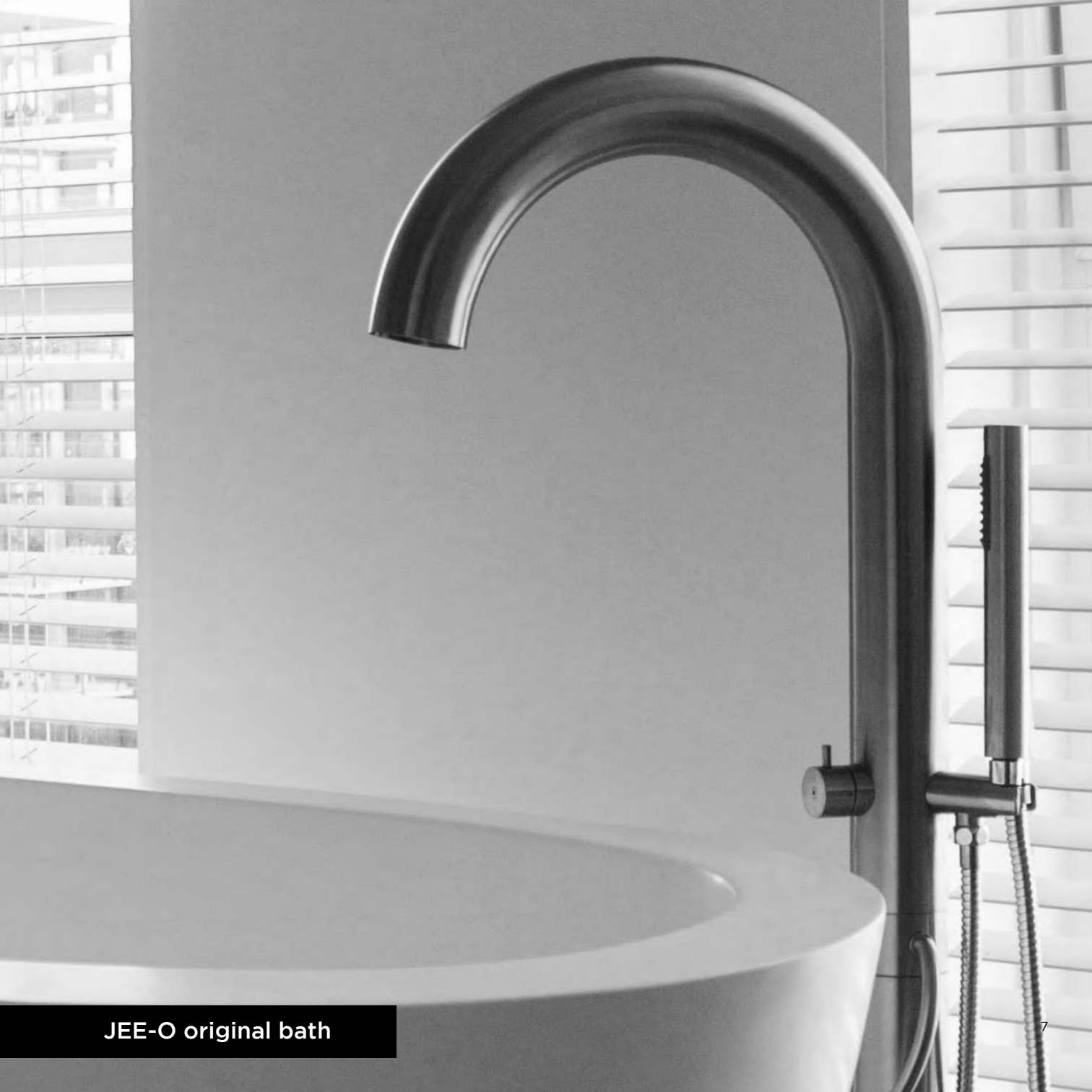
JEE-O original bath