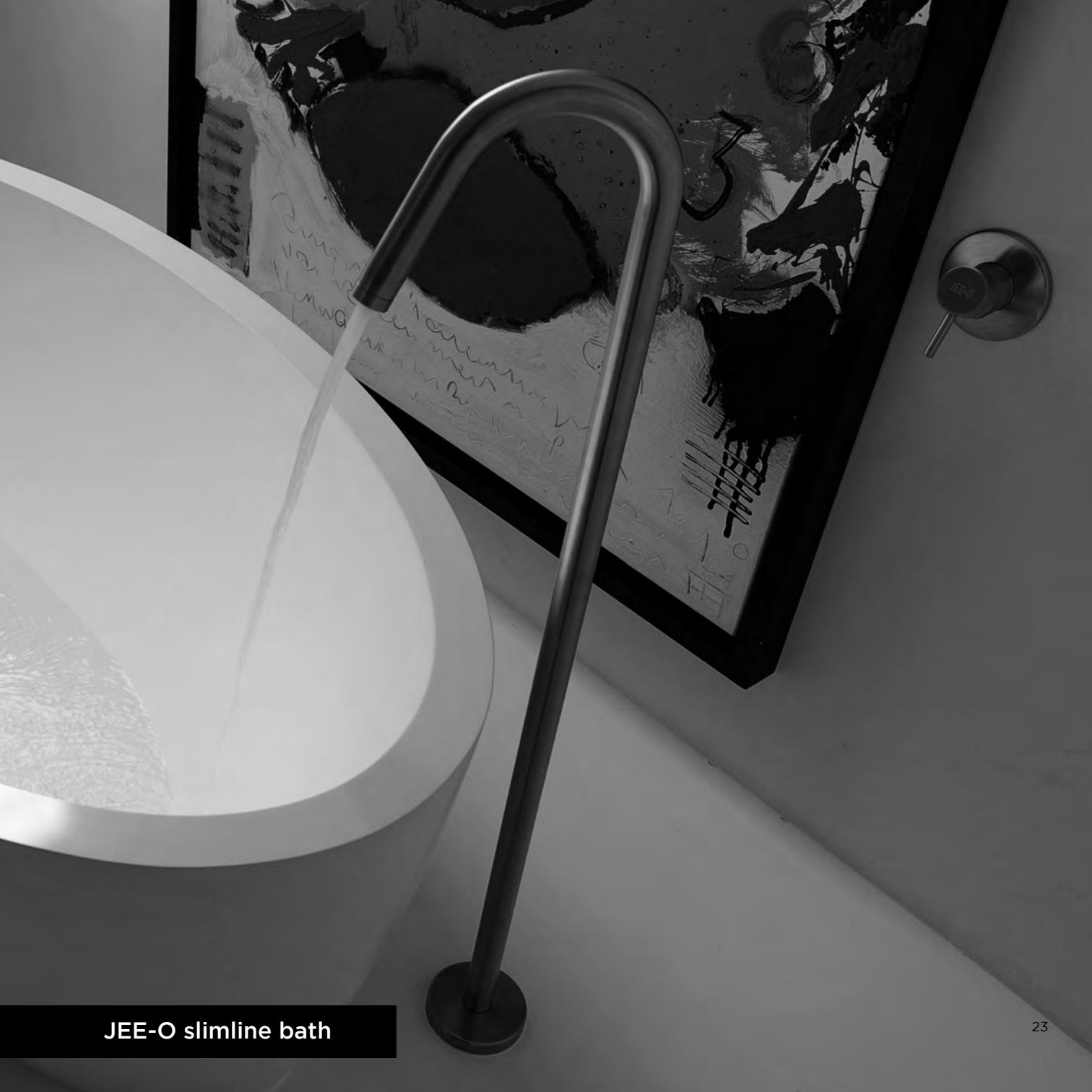
JEE-O slimline bath