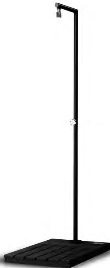
izi go by Bjorn van den Berg

Limited edition Freestanding shower with composite base made of stainless steel, powdercoated in matt-black and embellished with dark grey Swarovski faceted elements.