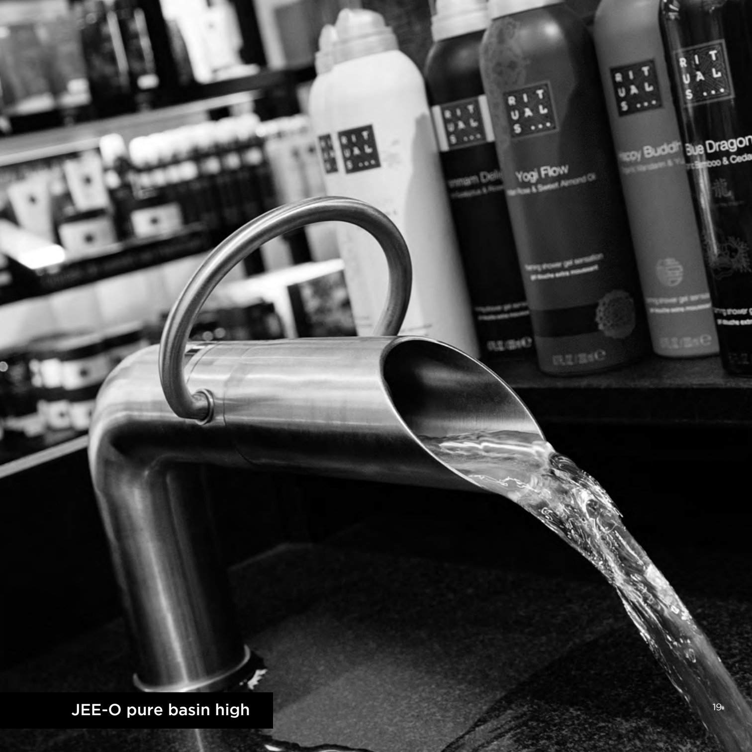
JEE-O pure basin high