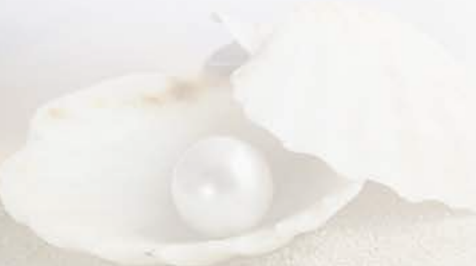
E 47 | SILBER-RING € 49,- mit weißer Süßwasser-Perle Ø 8,5-9 mm 925 Sterlingsilber, Weißgold vergoldet mit Zirkonia Steinen, Ringgröße verstellbar Art. Nr. 40511