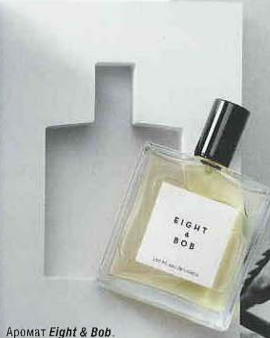
Аромат Eight & Bob.

Il est venu à Paris et a travaillé dans les ateliers de l'Éclair, un atelier d'art et de design, et a travaillé avec des artistes de renom. Il a travaillé avec des artistes de renom, et a travaillé avec des artistes de renom. Il a travaillé avec des artistes de renom, et a travaillé avec des artistes de renom.