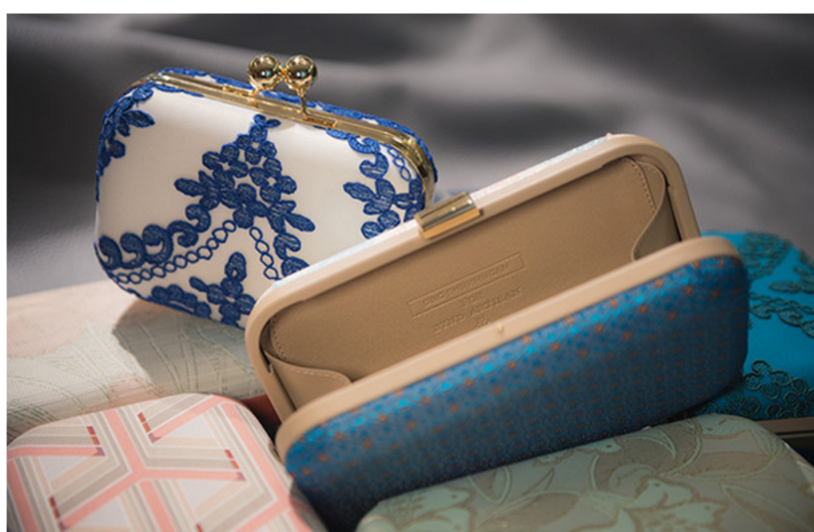
浓浓的亚洲元素设计非常独特大方