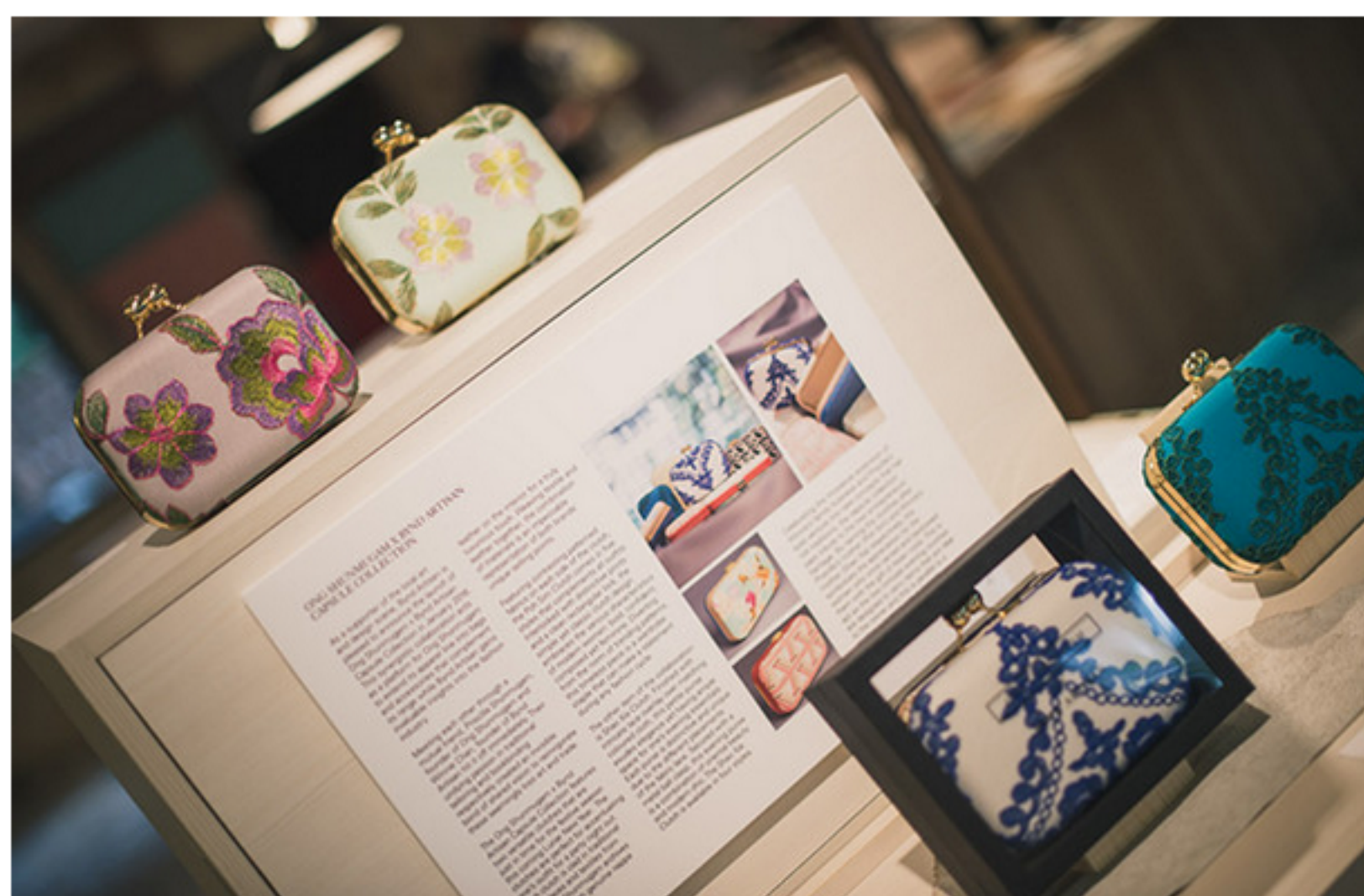
ONG SHUNMUGAM X BYND ARTISAN限量合作系列

限量手握袋现已在Ong Shunmugam和Bynd Artisan品牌专卖店售卖，售价$680。想为你的拜年装扮制造亮点，不妨考虑吧！