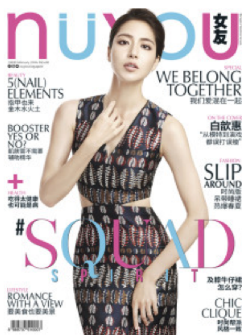
NÜYOU FEBRUARY 2016 ISSUE