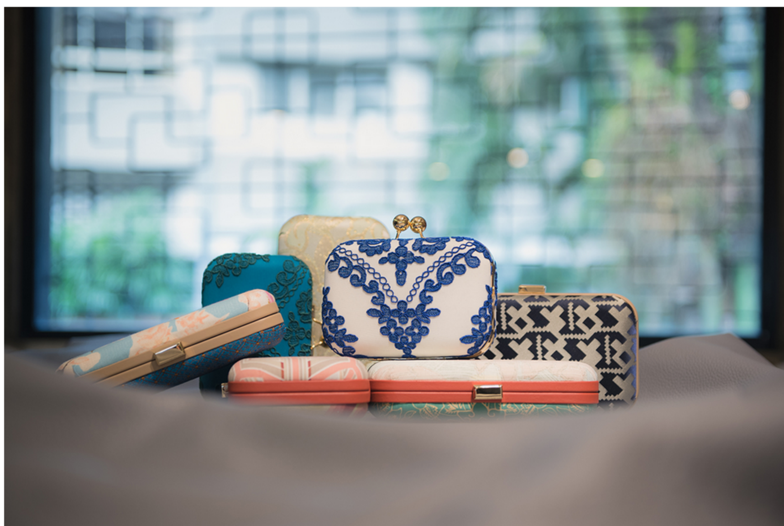
图 ONG SHUNMUGAM X BYND ARTISAN