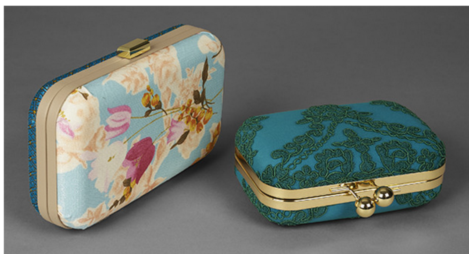
(左至右) Poh Sim手握袋($680)与Shao Xia手握袋($680)