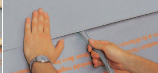
A termékfelirat mutatja az átlapolási sávot.