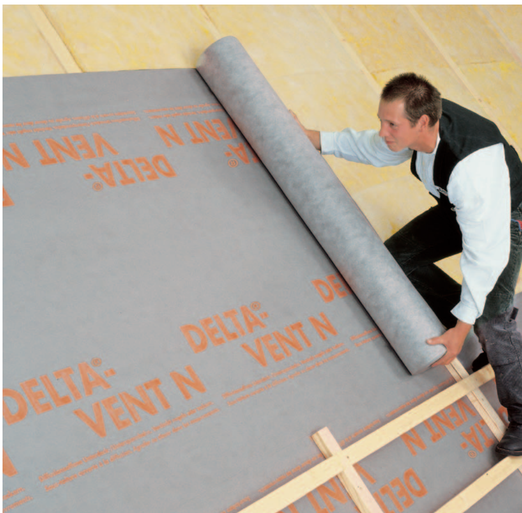
A DELTA®-VENT N 3 rétegű alátétfedés különlegesen könnyen beépíthető.