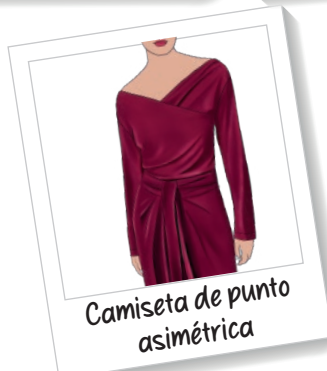
Camiseta de punto asimétrica