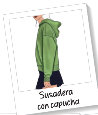
Susadera con capucha