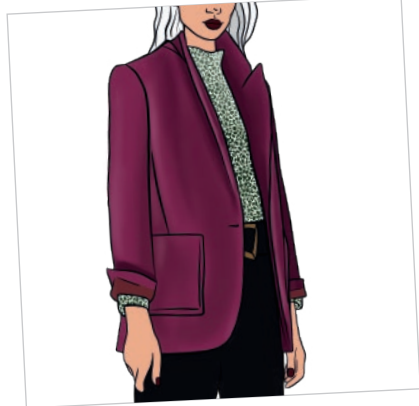
Americana clásica con bolsillo plastón