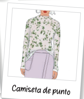
Camiseta de punto