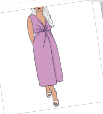
Drapeado en nudo