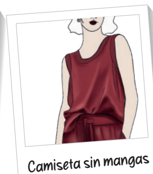
Camiseta sin mangas