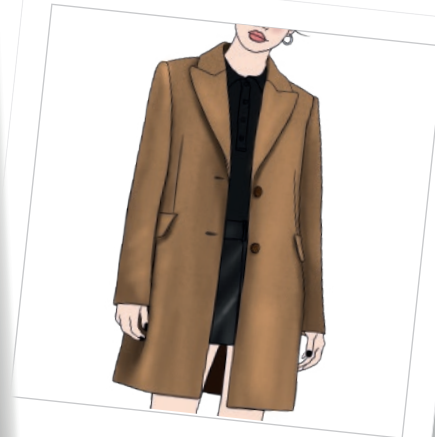
Abrigo tipo americana