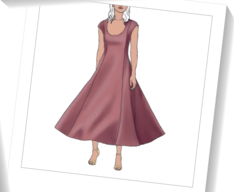
Vestido de cortes

Además de estos modelos propuestos, siempre dejamos tiempo en las tutorías para que los alumnos propongan diseños alternativos.