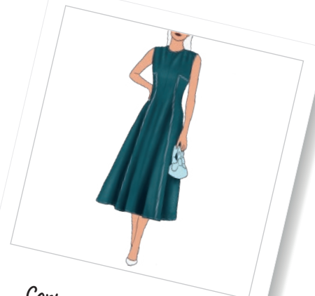
Corte princesa en ángulo