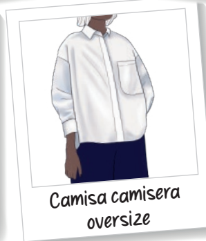
Camisa camisera oversize