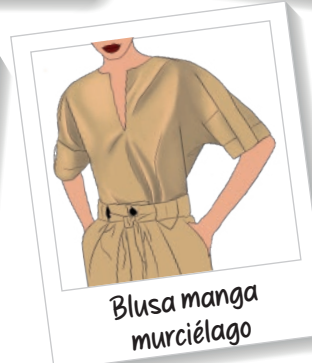
Blusa manga murciélago

Además de estos modelos propuestos, siempre dejamos tiempo en las tutorías para que los alumnos propongan diseños alternativos.