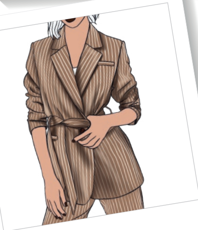
Americana con cinturón