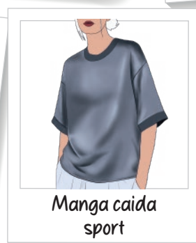
Manga caída sport