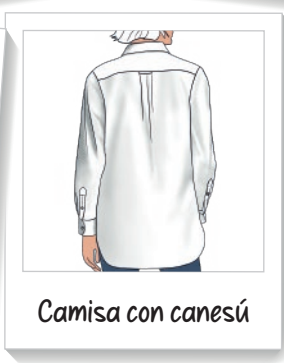
Camisa con canesú