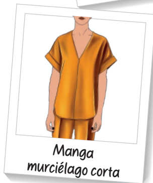
Manga murciélago corta