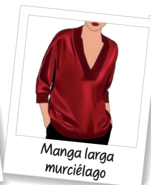
Manga larga murciélago