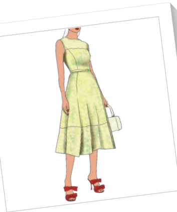
Corte princesa sport