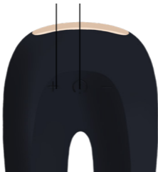
Botones de ENCENDIDO/APAGADO y Vibración

APAGADO: Mantenga presionado el botón por 3 segundos y la luz se apagará.