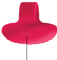
Botón de ENCENDIDO/APAGADO

APAGADO: Mantén presionado el botón ON por 3 segundos; la luz se apagará y el juguete se apagará.