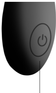
Botón de ENCENDIDO/APAGADO

APAGADO: Presiona el botón por 2 segundos y hasta que el juguete deje de funcionar y apagué su luz.