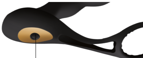
Botón de ENCENDIDO/APAGADO y VIBRACIÓN

APAGADO: Presiona el botón por 2 segundos hasta que el juguete deje de funcionar y apague su luz.