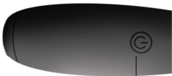
Botón de ENCENDIDO/APAGADO y VIBRACIÓN

APAGADO: Presiona el botón por 3 segundos hasta que el juguete deje de vibrar.