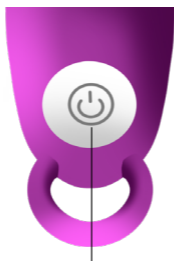
Botón de ENCENDIDO/APAGADO

APAGADO: Mantén presionado el botón por 3 segundos; la luz se apagará y el juguete se apagará.