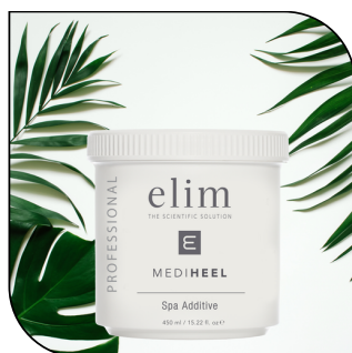
SPA ADDITIVE 62,50$

Exfolie avec une combinaison d'acides glycolique et lactique. Disponible en format 300ml et 500 ml (60 et 100 applications)