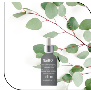
NAILFX 32$ SINGLE 182$ 6-PACK MSRP 60$

Un soin antibactérien pour les cuticules avec un mélange de 10 huiles pour garder les cuticules en bonne santé. Disponible en format pipette de 10 ml