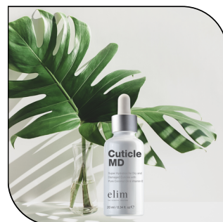
CUTICLE MD 23,50$

Finition parfaite d'une pédicure, Gold Spritz contient un éclat de brillance pour donner à vos pieds et à vos jambes un aspect et une sensation glamour. Disponible en 260 ml (750 applications)