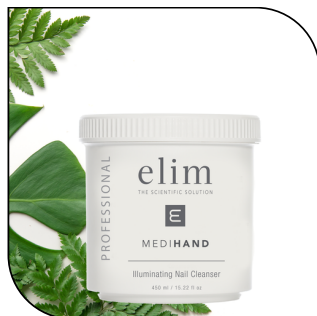
ILLUMINATING CLEANSER 70,50$

Un exfoliant quotidien au pH équilibré, avec des actifs chauffants pour améliorer l'absorption des ingrédients anti-âge. Disponible en tube de 450 ml (90 applications)