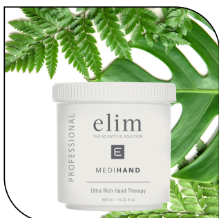
ULTRA RICH HAND THERAPY 79,50$

Masque à l'argile détoxifiant enrichi de plantes. Disponible en tube de 300 ml (60 applications)