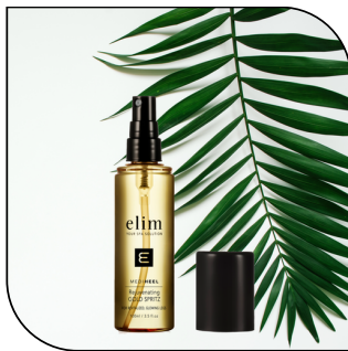
GOLD SPRITZ 27$ SINGLE 154$ 6-PACK MSRP 52$

Un traitement hydratant qui rétablit l'hydratation et combat les signes de l'âge. Disponible en format 100 ml