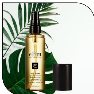
GOLD SPRITZ 53$

Une crème de massage qui hydrate la peau et lisse les ridules. Disponible en format 300 ml et 500 ml (60 et 100 applications)