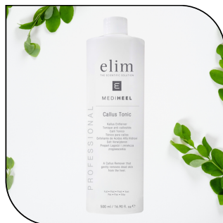
CALLUS TONIC 49$/69,50$/126,50$

Formulé pour nettoyer efficacement la peau. Disponible en flacon pulvérisateur de 250 ml