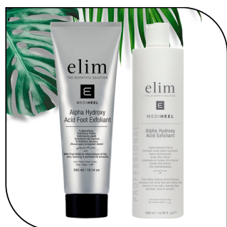
AHA EXFOLIANT 56$/76,50$

Rééquilibre le pH de la peau après le peeling des callosités. Disponible en format 200 ml et 500 ml (100 et 250 applications)