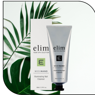
ILLUMINATING CLEANSER 24.50$ SINGLE 139.65$ 6-PACK MSRP 47$

Un exfoliant quotidien au pH équilibré avec des actifs chauffants pour améliorer l'absorption des ingrédients anti-âge. Disponible en tube de 100 ml