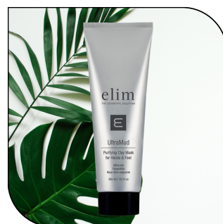
ULTRA MUD 77,50$

Un bain de pieds antimicrobien qui nettoie les pieds et les ongles. Disponible en bacs de 450 ml (150 applications)