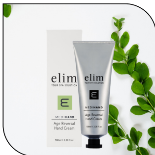
AGE REVERSAL HAND CREAM 47.50$ SINGLE 270.75$ 6-PACK MSRP 90$

NailFx est un puissant sérum pour les ongles, infusé d'ingrédients actifs naturels qui combattent les infections bactériennes et fongiques. Disponible en format pipette de 20 ml