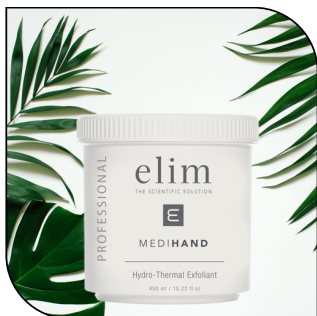
HYDRO THERMAL EXFOLIANT 115,50$

Un exfoliant quotidien au pH équilibré, avec des actifs chauffants pour améliorer l'absorption des ingrédients anti-âge. Disponible en tube de 450 ml (90 applications)