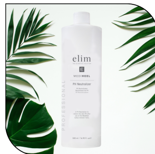
PH NEUTRALIZER 26$/48,50$

Assouplit les liaisons protéiques, ce qui facilite l'élimination de la peau sèche et calleuse des pieds. Disponible en formats de 200 ml, 500 ml et 1000 ml (25, 62 et 125 applications)