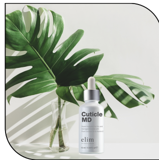
CUTICLE MD 16$ SINGLE 91$ 6-PACK MSRP 30$

Finition parfaite d'une pédicure, Gold Spritz contient un éclat de brillance pour donner à vos pieds et à vos jambes un aspect et une sensation glamour. Disponible en 100 ml