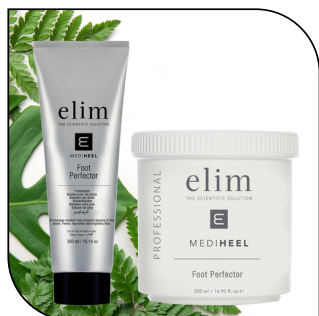
FOOT PERFECTOR 59$/73,50$

Masque à l'argile détoxifiant enrichi de plantes. Disponible en tube de 300 ml (60 applications)