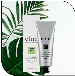
HYDRO THERMAL EXFOLIANT 30.50$ SINGLE 173.85$ 6-PACK MSRP 58$

Un exfoliant quotidien au pH équilibré avec des actifs chauffants pour améliorer l'absorption des ingrédients anti-âge. Disponible en tube de 100 ml