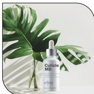
CUTICLE MD 23,50$

Un traitement hydratant qui rétablit l'hydratation et combat les signes de l'âge. Disponible en format 450 ml (180 applications)