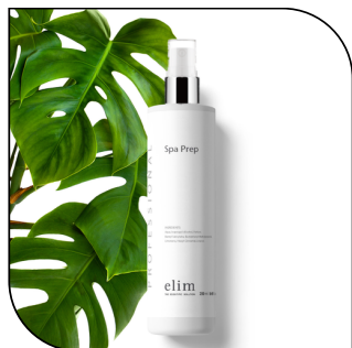
SPA PREP 21$

Formulé pour nettoyer efficacement la peau. Disponible en flacon pulvérisateur de 250 ml