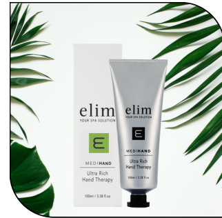
ULTRA RICH HAND THERAPY 30.50$ SINGLE 173.85$ 6-PACK MSRP 58$

Éclaircir et blanchir les ongles vieillissants et décolorés. Disponible en tube de 80 ml