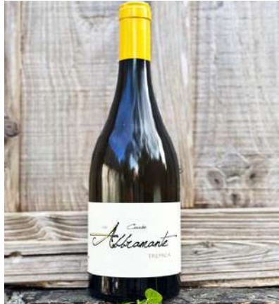
Abbramante - 2021