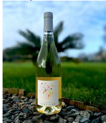
L'effet Papillon - 2022

Muscat, Vermentino IGP Méditerranée 4,60 € HT SO2 < 39mg/L