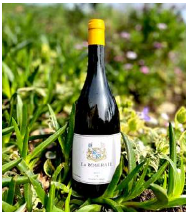
La Roseraie - 2020