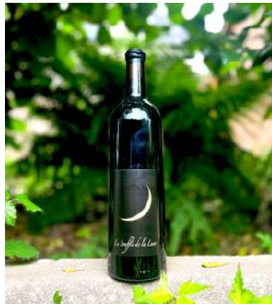
Le Souffle de la Lune - 2021

60% Gren, 20% Syr, 10% Mourv, 10% Cari 10,25 € HT SO2 < 25mg/L