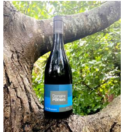
N°6 - 2022

100% Gamay Saint Romain 8,75 € HT SO2 < 30mg/L