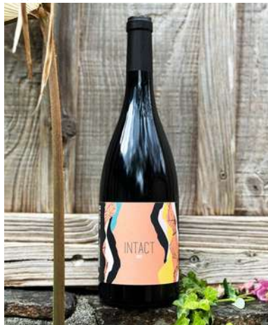
Intact - 2022

80% Merlot, 20% Marselan 5,90 € HT SO2 <30mg/L