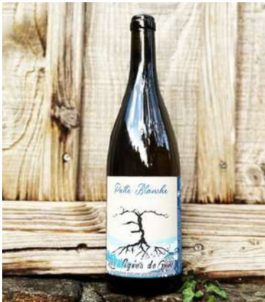
Patte Blanche - 2023

80% Grenache, 20% Roussanne 7,50 € HT SO2 < 10mg/L