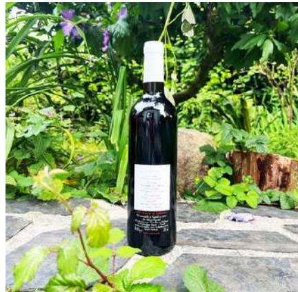
Grenache - 2011

100% Grenache 14,00 € HT Sans SO2 ajouté