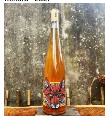
Renard - 2021