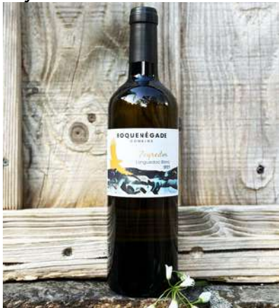
Peyredon - 2021

70% Roussanne, 30% Grenache Blanc 7,35 € HT SO2 < 40mg/L