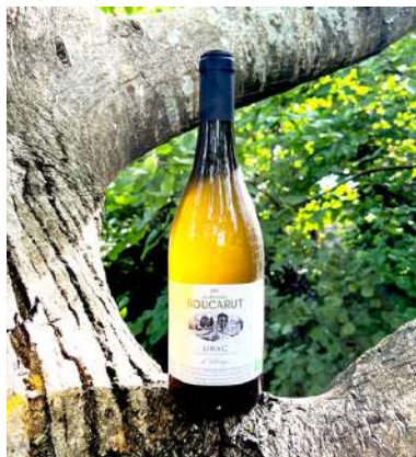
Lirac Blanc 2021

Roussanne, Viognier 9,95 € HT SO2 < 10mg/L