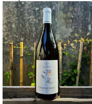
Champ de Pierre - 2022