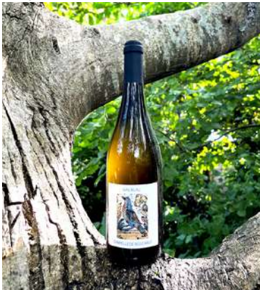
Gag Blau - 2023

Roussanne, Viognier 7,20 € HT SO2 < 3mg/L