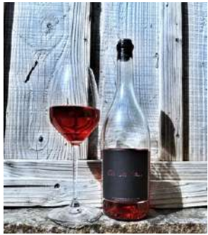
Envole-moi - 2022

Situées à plus de 300 mètres d'altitude, au coeur de la vallée de l'Agly, les vignes du Mas de le Lune bénéficient d'un terroir extrêmement riche de schistes et d'arènes granitiques. Les vieilles vignes qui le caractérisent correspondent à un encépagement typiquement catalan. On retrouve ainsi le Grenache Noir, cépage gourmand, le Macabeu, cépage blanc très aromatique, le Mourvèdre, qui apporte des tanins et des arômes de fruits noirs épicés, le Carignan, qui apporte de la puissance et de la structure aux vins rouges ainsi que la Syrah et le Grenache Gris. Ces cépages sont vendangés à la main et en cagettes. Les vins sont sans intrants, ni filtrés, ni collés.