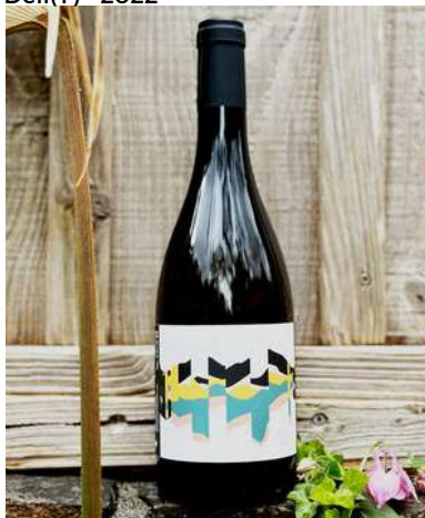
Déli(T) - 2022

Les vendanges sont manuelles, levures indigènes, dose infinitésimale de SO2 quand cela est nécessaire. Les vins sont élevés en barriques, demi-muids, en jarre et en amphore 1 an minimum. Les vins sont non collés, non filtrés.