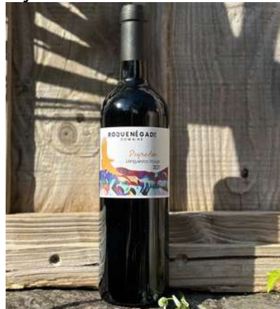
Peyredon - 2021

80% Syrah - 20% Grenache 7,90 € HT SO2 < 40mg/L