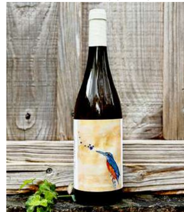
Léonides - 2022- NOUVEAUTÉ