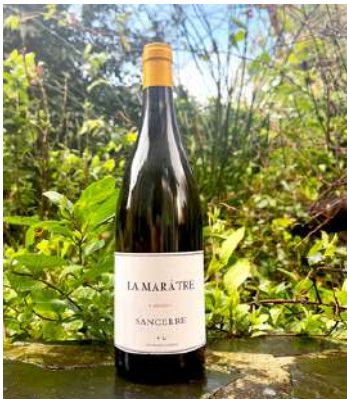
La Marâtre - 2021

Les vinifications s'effectuent dans des cuves inox en forme de fût, celles-ci durent le plus longtemps possible, ni levures, ni additifs superflus. Les Vins sont sans intrants, non collés, ni filtrés.