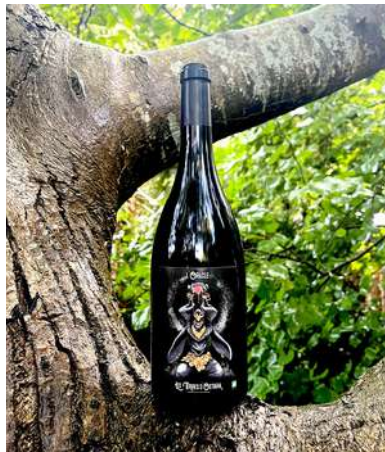
L'Oracle - 2022