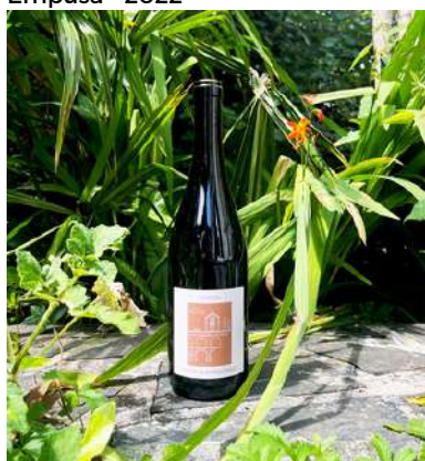
Empusa - 2022