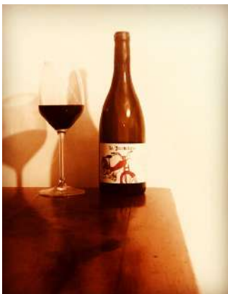
Oiseau - 2019