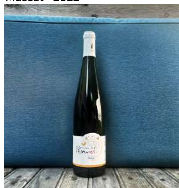
Muscat - 2022