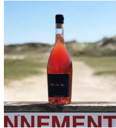
Oh La La - 2022

70% Syrah, 30% Grenache noir 7,25 € HT SO2 < 20mg/L