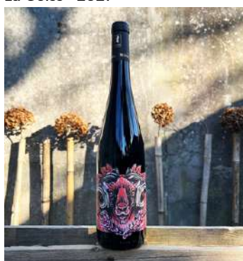
La Geiss - 2021