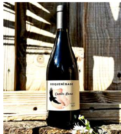
Combe Noire - 2021

50% Syrah, 50% Carignan 9,90 € HT SO2 < 40mg/L