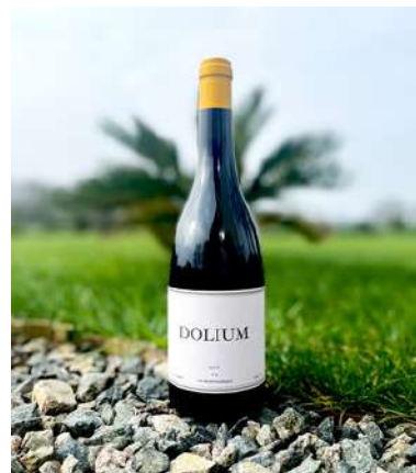
Dolium - 2020