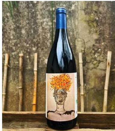
Fille du vent - 2022- NOUVEAUTÉ