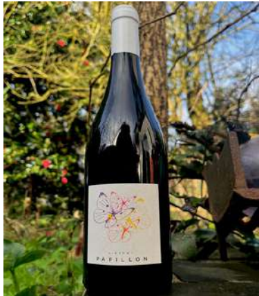
L'effet Papillon - 2022

Cinsault, Merlot IGP Méditerranée 4,50 € HT SO2 < 26mg/L