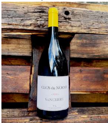
Clos du Nozay - 2021