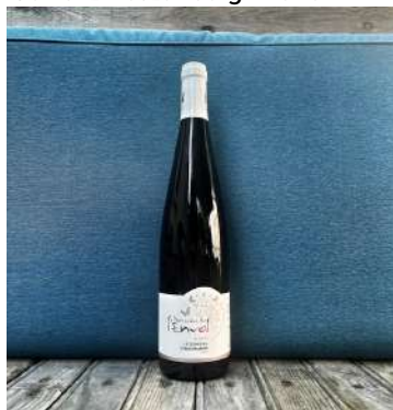
Gewurz Letzenberg - 2020