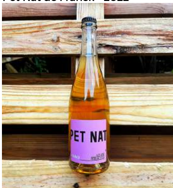
Pet Nat de Franck - 2022

80% Gewurz, 10% Muscat, 10% Chenin 9,80 € HT SO2 = 12mg/L