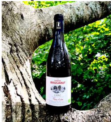
Lirac Rouge - 2020

Grenache, Syrah, Mourvèdre, Cinsault 8,90 € HT SO2 < 10mg/L