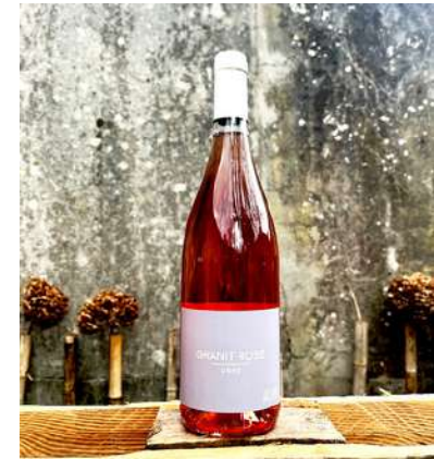
Granit Rose - 2022

100% Gamay Saint Romain 6,25 € HT SO2 < 53mg/L