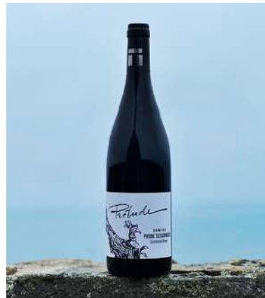
Prélude - 2023

80% Syrah, 20% Grenache 6,40 € HT SO2 < 36mg/L