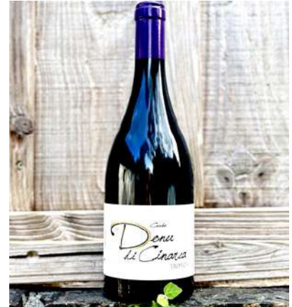
Donu di Cinarca - 2021

100% Carcaghjolu Neru 20,50 € HT SO2 < 20mg/L