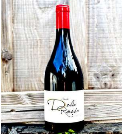
Dolia Rossa - 2021

90% Sciaccarellu, 10% Niellucciu 17,30 € HT SO2 < 20mg/L