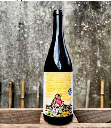
Échappée Belle - 2022

60% Grenache, 40% Syrah 6,35 € HT SO2 < 20 mg/L