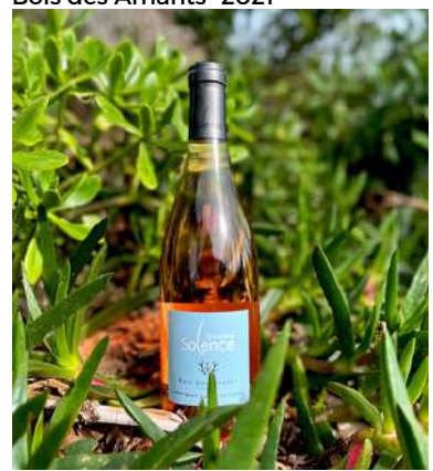
Bois des Amants- 2021

Grenache Noir, Cinsault AOP Ventoux 5,20 € HT SO2 < 40mg/L