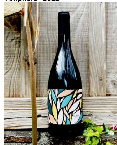
Amphore - 2022