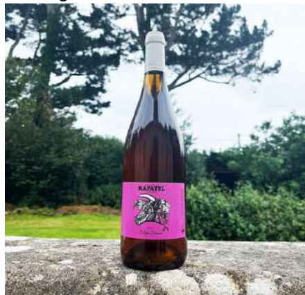
Rosé Signature - 2020

Grenache, Carignan 7,50 € HT Sans SO2 ajouté