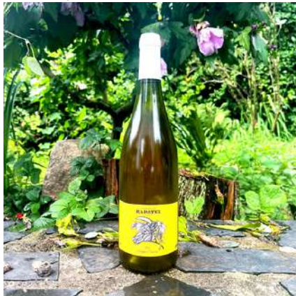
Blanc Signature - 2019

Grenache, Marsanne 8,15 € HT Sans SO2 ajouté