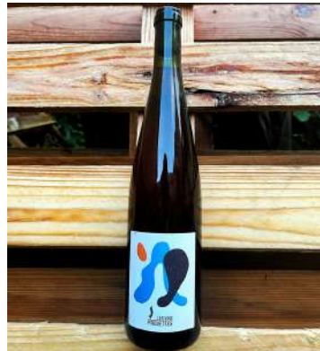
Eros de David - 2023