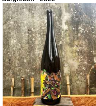
Burgreben - 2022