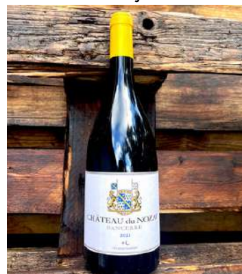
Château du Nozay - 2021