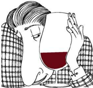
Les Débonnaires - 2018

Les Vins sont sans intrants, non collés, ni filtrés.