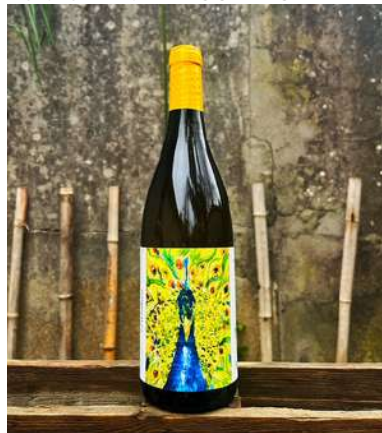
Darshan - 2022- NOUVEAUTÉ

75% Vermentino, 25% Viognier 6,90 € HT SO2 < 20mg/L