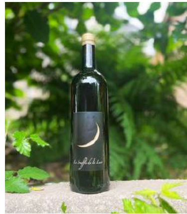
Le Souffle de la Lune - 2022

50% Grenache gris, 50% Macabeu 9,25 € HT SO2 < 18mg/L