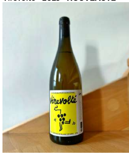
Virevolté - 2023 - NOUVEAUTÉ

50% Grenache blanc, 50% Grenache gris 6,30 € HT SO2 < 20 mg/L