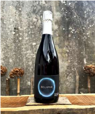
Éclipse - 2022

100% Gamay St Romain 9,25 € HT SO2 < 52mg/L