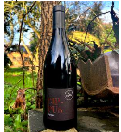
Cippus - 2020

Grenache, Syrah AOP Ventoux 7,50 € HT SO2 < 79mg/L