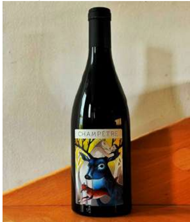
Champêtre 2023 - NOUVEAUTÉ

80% Grenache Noir, 10% Muscat, 10% Syrah 7,00 € HT SO2 < 20mg/L