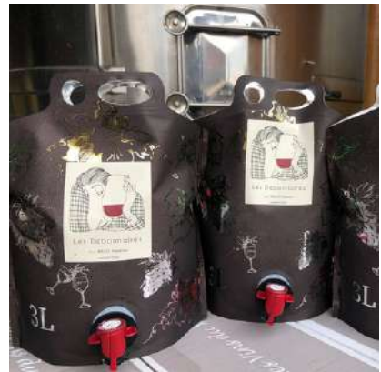
Les Débonnaires - 2018