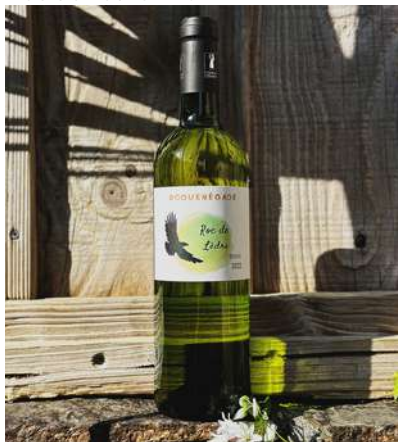
Roc de Lèdre - 2022