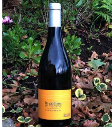
La Colline en flamme - 2022

100% Chardonnay - VDF 6,60 € HT SO2 < 49mg/L