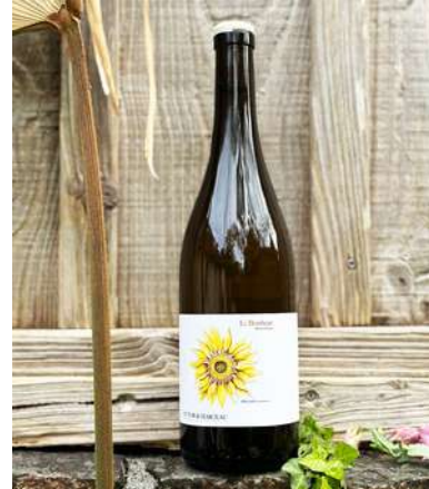
Le Bonheur - 2023

100% Romorantin 10,40 € HT SO2 < 20 mg/L