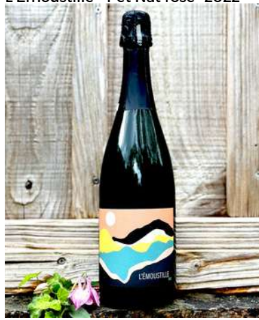
L'Émoustille - Pet Nat rosé - 2022

85% Muscat de Hamburg, 15% Merlot 7,10 € HT Sans SO2 Ajouté