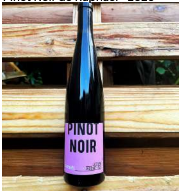
Pinot Noir de Raphaël - 2020

Parce que ce projet, c'est aussi une autre façon de faire du commerce de vins. A noter que ce n'est pas du négoce. Les Vins sont sans intrants, non collés, ni filtrés.