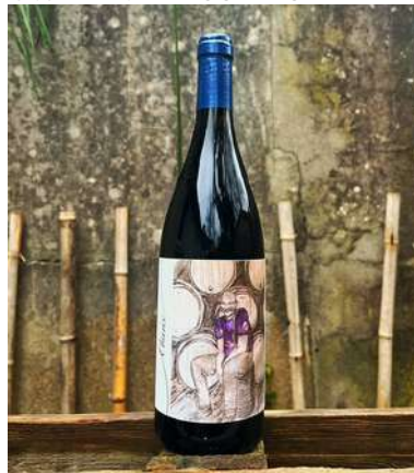
Obarix - 2021- NOUVEAUTÉ

70% Grenache, 30% Syrah 8,00 € HT SO2 < 20mg/L