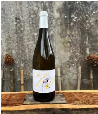
La Jolie Folle - 2022

100% Melon de Bourgogne 5,20 € HT SO2 < 22 mg/L