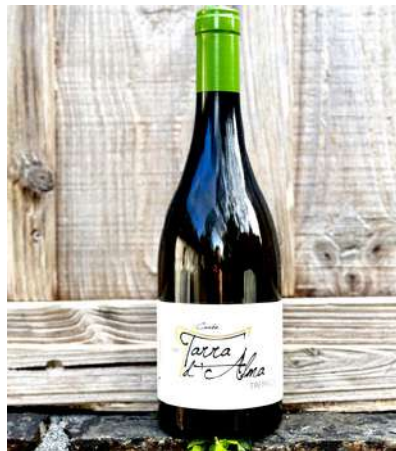
Tarra d'Alma - 2021