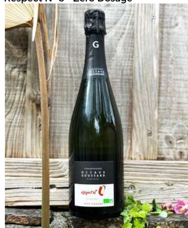
Respect N° 0 - Zéro Dosage