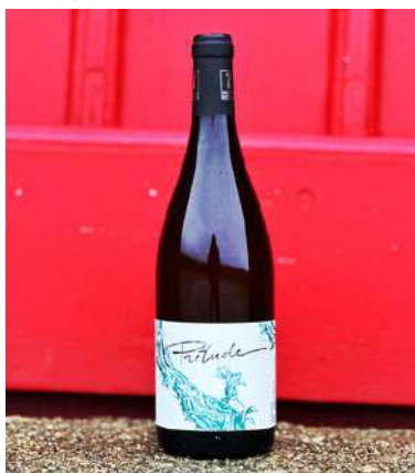
Prélude - 2022

70% Grenache, 30% Rolle 6,40 € HT SO2 < 50mg/L