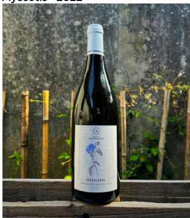
Myosotis - 2022

En plein cœur du village, leur chai appartenait à un ancien viticulteur qui cherchait à transmettre son lieu à des jeunes vigneron. Le bon combo, les planètes alignées, et le premier millésime fût sorti en 2022. Leur Chenin tout tracé, deux cuvées sont sortie du premier millésime, un 100% chenin en assemblage pour la cuvée Myosotis et en parcellaire pour les champs de pierre qui est une petite parcelle avec un sol très caillouteux. D'autres cuvées complètent la gamme, un parcellaire "la Fuye" (un chenin élevé en fut) et une macération de chenin et de melon blanc en attendant la sortie de leur cabernet franc prévue fin 2024. L'approche de la vigne est bien sûr vertueuse, ici pas de chimie, un peu de cuivre, des concoctions de plantes, un tressage pour renforcer et protéger le cep et raisin et au chais on laisse tranquillement le vin grandir et vieillir dans de jeunes barriques au milieu de la cave souterraine... Les Vins sont sans intrants, non collés, ni filtrés.