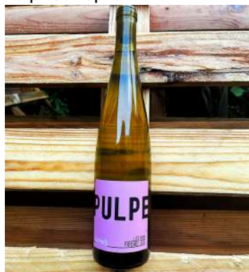
Pulpe de Raphaël - 2022

Sylvaner, Riesling, Auxerrois, Chasselas 6,95 € HT SO2 = 31mg/L