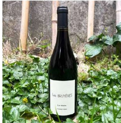
Les Bruyères - 2018

100% Cabernet Franc 9,70 € HT SO2 < 10mg/L