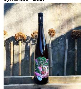
Symbiose - 2021