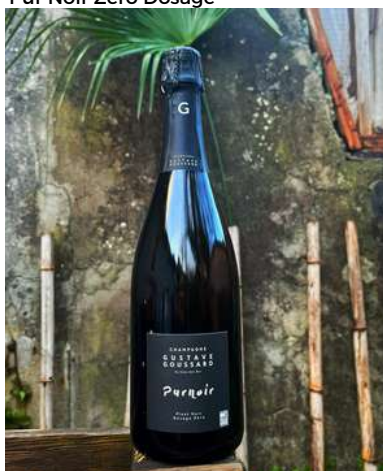
Pur Noir Zéro Dosage

Nous n'avons donc aucune réserve sur les contrôles que les organismes certificateurs indépendants (ECOCERT et AFNOR) peuvent faire sur la traçabilité de nos pratiques.