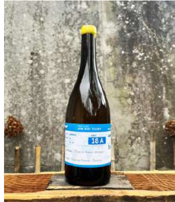
One Way Ticket - 2021

100% Melon de Bourgogne 11,50 € HT SO2 < 11mg/L