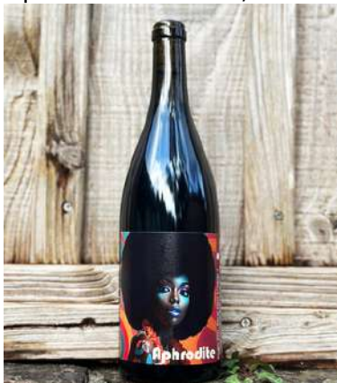
Aphrodite - 2023 Mise 10/2024