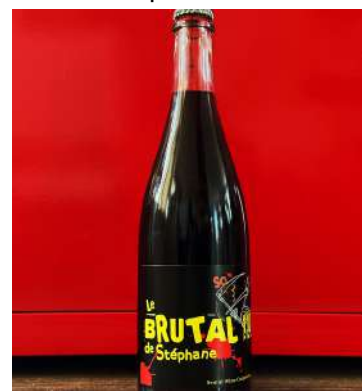
Brutal de Stéphane - 2020