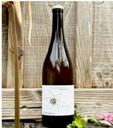
Dame de 11 Heures - 2023

50% Chardonnay, 50% Chenin 8,70 € HT SO2 < 20 mg/L