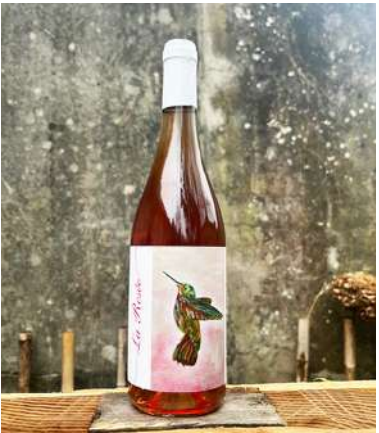
La Rosée - 2022- NEW MILLÉSIME

100% Muscat de Hamburg 5,75 € HT SO2 < 20 mg/L