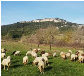
Vermeil - 2022

Les Vins sont sans intrants, non collés, ni filtrés.