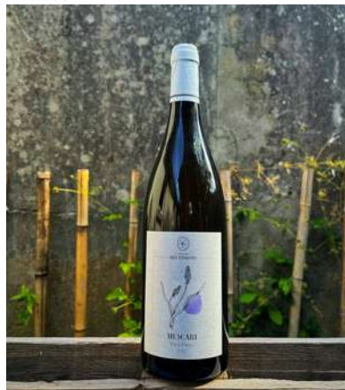
Muscari - 2022

100% Melon Blanc 7,50 € HT SO2 < 30 mg/L