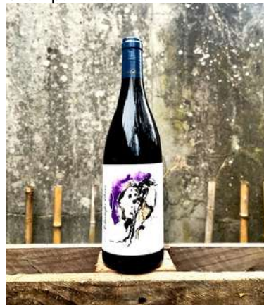
Champs-Libres - 2022- NEW MILL

60% Syrah, 40% Grenache 6,90 € HT SO2 < 20 mg/L