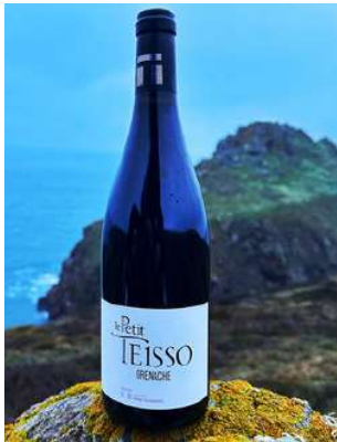
Le Petit Teisso - 2023

Les Vins sont sans intrants, levures indigènes, non collés, légèrement filtrés.