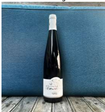
Pinot Gris Steinweig - 2019