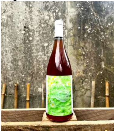
Tango - 2023- NEW MILLÉSIME