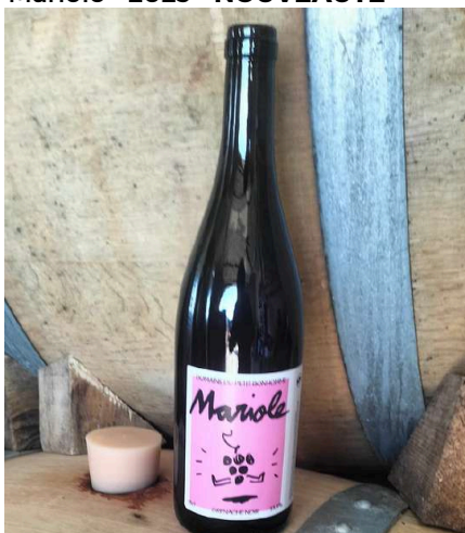
Mariole - 2023 - NOUVEAUTÉ