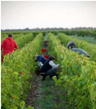
Euphrosyne - 2023

C'est leur premier millésime et déjà beaucoup de succès, les quilles partent comme des petits pains, ravissent professionnels et particuliers, ce qui est sûr c'est qu'il n'y en aura pas pour tout le monde !