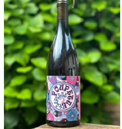
Poupette - 2023 - Mise 05/2024