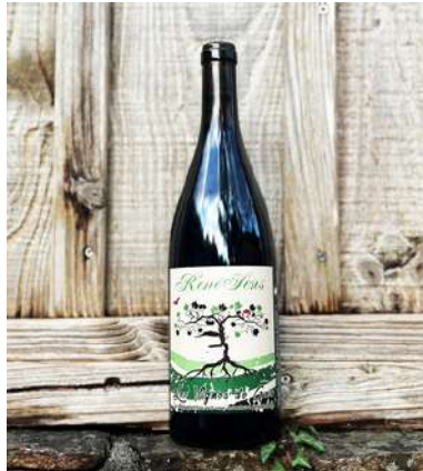
René Sens - 2023