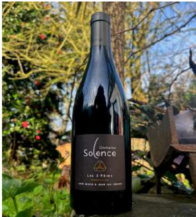
Les 3 Pères - 2021

Grenache, Syrah AOP Ventoux 4,90 € HT SO2 < 46mg/L