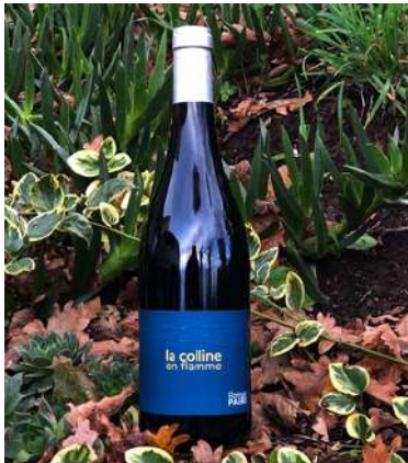
La Colline en flamme - 2022

100% Gamay Saint Romain 6,60 € HT SO2 < 30mg/L