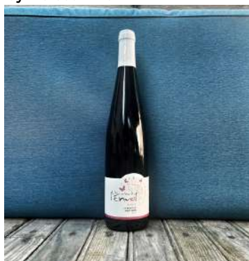
Symbiose - 2022

Demeter est la marque internationale de certification de l'agriculture biodynamique qui permet de reconnaître les produits issus de celle-ci. Déposé dès 1932, le logo fait référence à la déesse de la fécondité et mère de la Terre dans la mythologie grecque. Ce label se démocratise de plus en plus et les adhérents partagent la même philosophie. Les Vins sont sans intrants, non collés, ni filtrés.