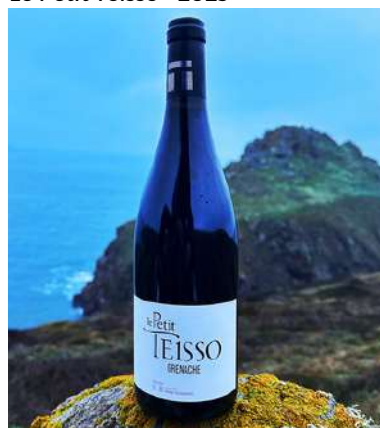
Le Petit Teisso - 2023