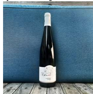
Sylvaner Dorfburg - 2022