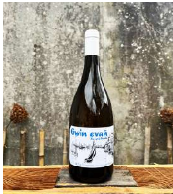
Gwin Evañ - 2022

100% Melon de Bourgogne 6,70 € HT SO2 < 40mg/L