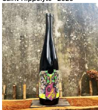
Saint-Hippolyte - 2020