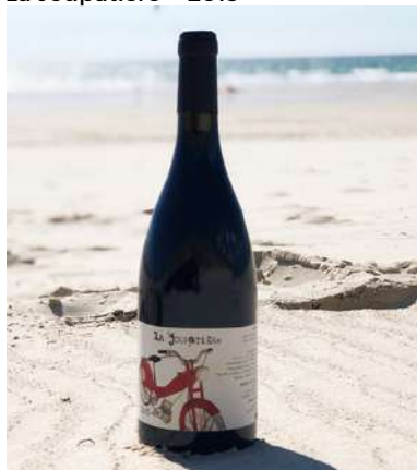
La Joupatière - 2019

15 Cépages - Vieilles Vignes 16,50 € HT SO2 < 10mg/L