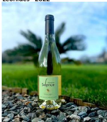
Léonides - 2022

Grenache, Clairette IGP Méditerranée 5,40 € HT SO2 < 79mg/L