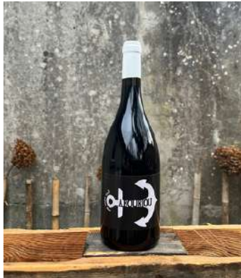
Abouriou - 2021