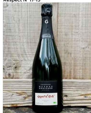
Respect N° 17-15

100% Pinot Noir 22,50 € HT Dosage : 6g/L