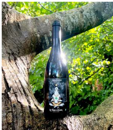
L'Ambassadeur - 2022

Pour la grande majorité des parcelles, les vignes ont environ 25 ans sauf deux qui avoisinent plutôt les 60 ans, l'ensemble est certifié bio depuis une dizaine d'années composé de deux îlots avec des terroirs bien distincts. Un premier de 3ha entouré de forêts avec des sols limoneux-argileux où se trouve le gamay, le côté (malbec) et une partie des cabernets francs. Le deuxième de 1,5 ha est situé plutôt sur un plateau avec des sols très limoneux avec de nombreux silex où se situe le reste des cabernets et du sauvignon (le seul cépage blanc pour l'instant). Les vendanges se font manuellement en caisses pour garder les raisins intacts jusqu'au pressoir, une vinification douce (peu de remontages, peu voir pas de foulage) pour laisser s'exprimer le terroir ainsi que les arômes des cépages. Les Vins sont sans intrants, non collés, ni filtrés.