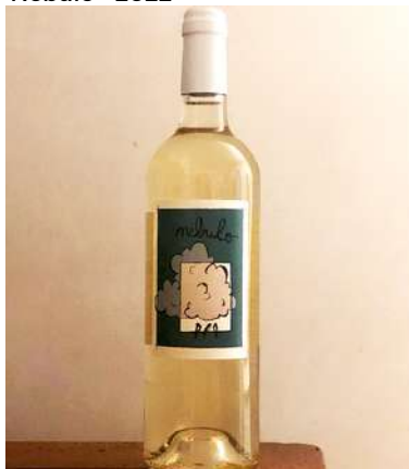
Nébulo - 2022

60% Roussanne, 40% Grenache gris 6,70 € HT SO2 < 50mg/L