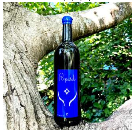
Bohémienne - 2011/12/13/14/15

100% Grenache 15,00 € HT Sans SO2 ajouté