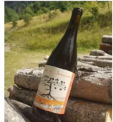
Tchin à Janette - 2023 Mise 05/2024