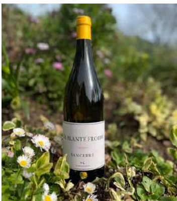
La Plante Froide - 2022