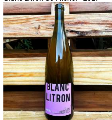
Blanc Litron de Michel - 2021

100% Riesling - 1 Litre 9,30 € HT SO2 = 2mg/L