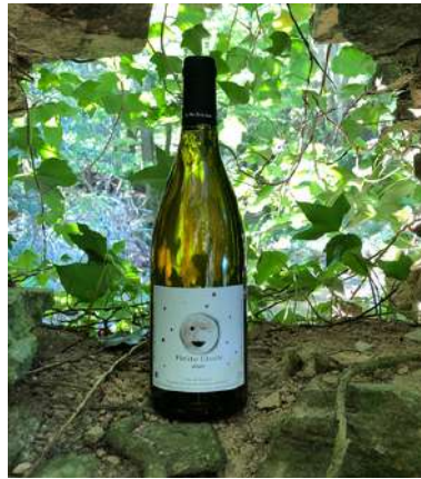
Petite étoile - 2022

50% Grenache Blanc, 50% Macabeu 6,25 € HT SO2 < 18mg/L