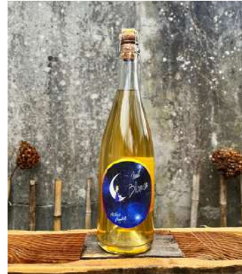
Nuit Blanche - 2021

100% Melon de Bourgogne 9,70 € HT SO2 < 10 mg/L