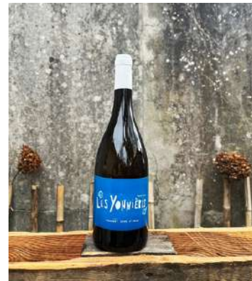
Les Yonnières - 2021

100% Melon de Bourgogne 8,60 € HT SO2 < 36mg/L