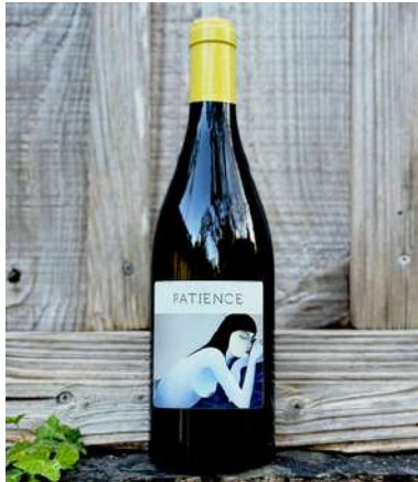
Patience - 2022- NOUVEAUTÉ

40% bourboulenc, 30% chardonnay 20% muscat, 10% Ugni 9,90 € HT SO2 < 20mg/L