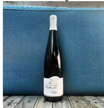
Auxerrois Letzenberg - 2019