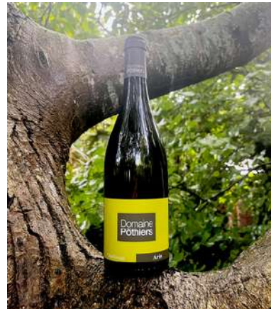
Aris - 2022

100% Pinot Gris - IGP Urfé 8,75 € HT SO2 < 50mg/L