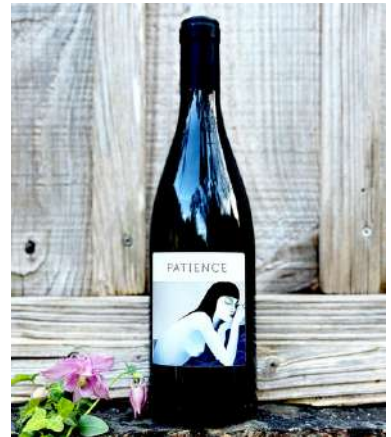
Patience - 2022- NOUVEAUTÉ