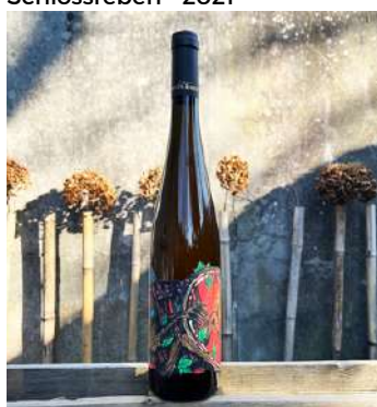
Schlossreben - 2021