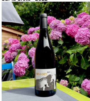
Sur la Crête - 2022

60 % Grenache, 40% Mourvèdre 8,35 € HT Sans SO2 ajouté