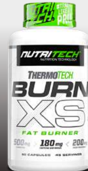
Burn XS Fat Burner 90 Caps