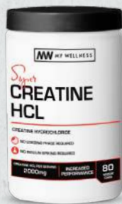
Creatine HCL 80 Veggie Caps