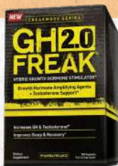
GH Freak 2.0 120 Caps