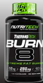
Thermotech Burn 8 120 Caps