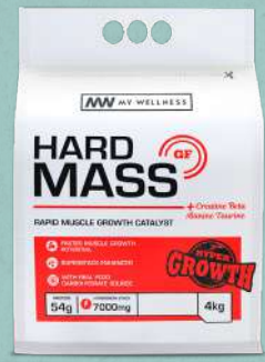
Hard Mass GF 4kg