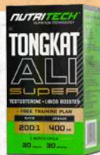
Tongkat Ali 30 Tabs