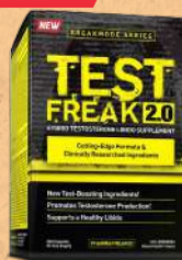
Test Freak 2.0 180 Caps