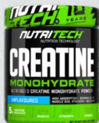
NutriTech Creatine Monohydrate 300g