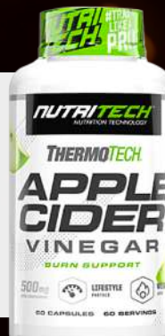
Apple Cider Vinegar 60 Caps