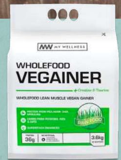
Wholefood Vegainer 3.6kg