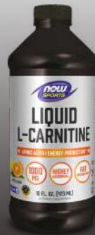
Liquid L-Carnitine 1000mg 473ml