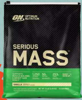
Serious Mass 5.4kg