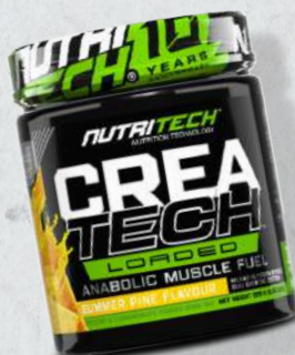
Creatch Loaded 625g