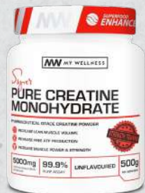
Pure Creatine Monohydrate 500g