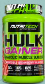
Hulk Gainer 900g