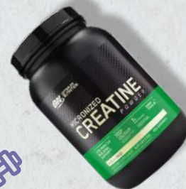
Micronized Creatine Powder 317g