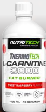
L-Carnitine 3000 400ml