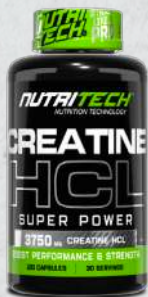
Creatine HCL 120 Caps