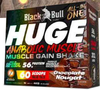
HUGE Anabolic Muscle 4kg