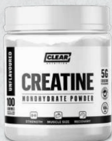
Creatine Monohydrate 500g