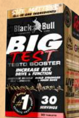
Big Test 90 Tabs