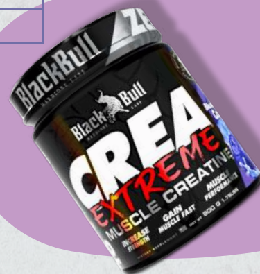
CREA Extreme 800g