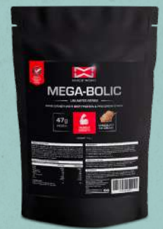
Mega Bolic 1.5kg