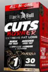
Cuts Burner Extreme Fat Loss 90 Caps