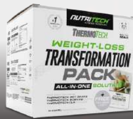
Weight-Loss Transformation Pack