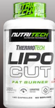
ThermoTech Lipocut 120 Caps