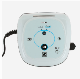
Caixa de comando