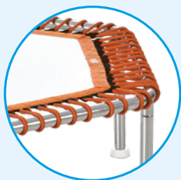
Elastici morbidi adatti all'uso acquatico