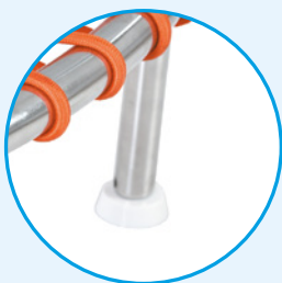
Piedi con ventosa in silicone bianco antiscivolo