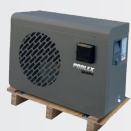
Se entrega en palé de madera