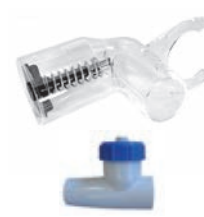
Vacuómetro y válvula de ajuste