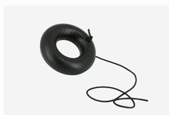
Anel flutuante ajuda na saída da água