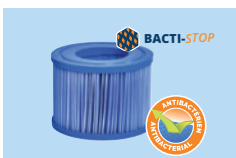
1 cartuccia del filtro antibatterico inclusa