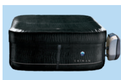
Coperta isotermica sicura