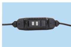
Presse elettrica con protezione da dispersione a terra 10 mA