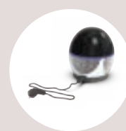
fácil de usar com Plug & Play