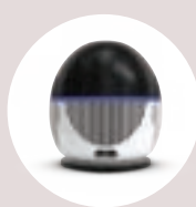
Grande evaporador para troca de calor óptima