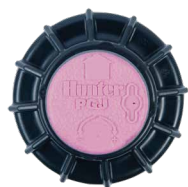
PGJ de água residual

Disponível como opção instalada na fábrica em todos os modelos