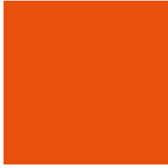
UHPC IP E230 LARANJA ORANGE | ORANGE NARANJA