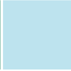
UHPC IP S419 AZUL BLUE | BLEU AZUL